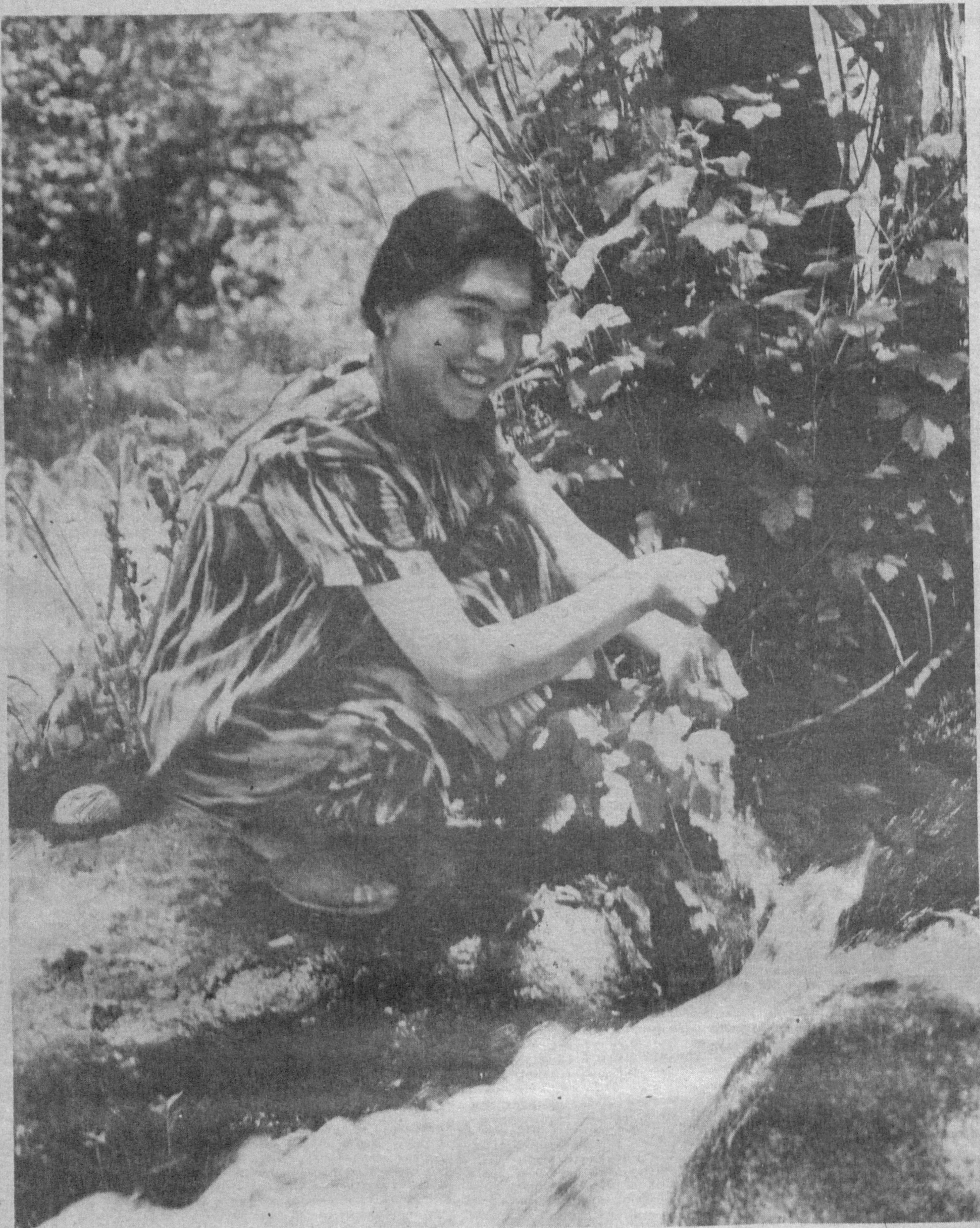
Сой соҳили сўлим-сўлим.