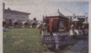
Нукусда II Халқаро бахшичилик санъати фестивали томошалари бошланди.

Шанхай ҳамкорлик ташкилотига аъзо мамлакатлар етакчилари жума кун Эронни ташкилотга доимий аъзо қилиб олиш бўйича ҳужжатни маъқуллашди.