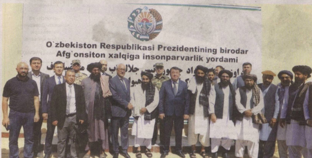
O'zbekiston Respublikasi Prezidentining birodar Afg'oniston xalqiga insonparvarlik yordami

Мамлакатимиз минтақамиздаги Афғонистон билан чегарадош уч давлатнинг бири. Ушбу давлат билан умумий чегарамиз 144 километрга узанган.