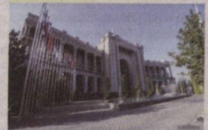
ШХТ раислигини Ўзбекистон қабул қилиб олди.

Тожикистон пойтахти Душанбе шаҳрида 17 сентябрь кун Шанхай ҳамкорлик ташкилоти Давлат раҳбарлари кенгашининг юбилей мажлиси бўлиб ўтди. Тожикистон Республикаси Президенти Эмомали Раҳмон раислигида ўтган мажлисда ШХТга аъзо давлатлар етакчилари – Ўзбекистон Республикаси Президенти Шавкат Мирзиёев, Ҳиндистон Республикаси Бош вазири Нарендра Моди, Қозоғистон Республикаси Президенти Қасим-Жомарт Тоқаев, Хитой Халқ Республикаси Раиси Си Цзиньпин, Қирғиз Республикаси Президенти Садир Жапаров, Покистон Ислам Республикаси Бош вазири Имрон Хон ва Россия Федерацияси Президенти Владимир Путин иштирок этди.