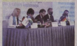
Пойтахтимизда Марказий Осиёда туберкулёзни интеграциялашган тарзда назорат қилиш бўйича бешинчи халқаро конференция ўтказилди.