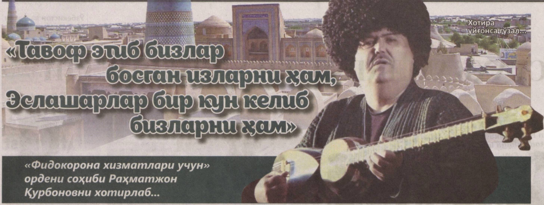
Хотира ўйғонса, гўзал...