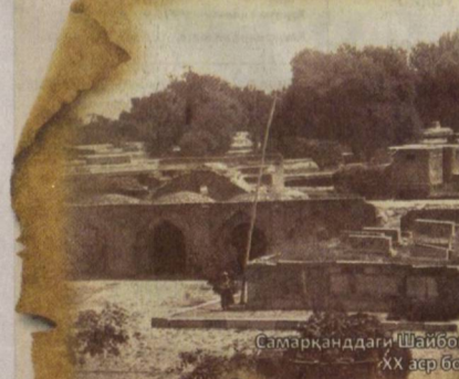
Самарқанддаги Шайбонийлар даҳмаси. ХХ аср бошларидаги фото

Мустақил Ўзбекистон тарихчилиги ҳам совет даври парадигмаларидан чиқиб кетмаляпти: совет мактаби яратган умумий қараш скелети, даврлаштириш тўғрисида сақлаб қолingan, тарихий шахслар пантеони деярли ўзгармаган (Амир Темуру қўшилган), ёнда- шув- л и