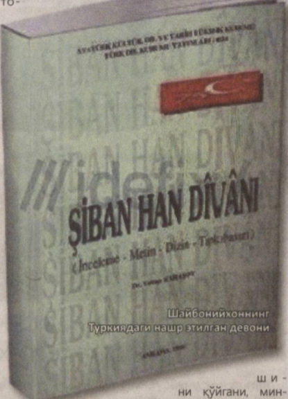
Шайбонийхоннинг Туркиядаги нашр этилган девони

Акс-садо катта ва барқарор давлат яратиб, бир аср давомида минтақанинг иқтисодий, маданий ва сиёсий ўсиши- ни таъминлаган. Уларнинг даврида фан ва маданият ривожланган. Фарбдан иқтисодий, техник ва мада- ний томондан ортада қолиш кейинги асрларда кўзга ташлана бошлаган ва умуман мусулмон оламига хос ҳодисадир. Бу – алоҳида ва жуда катта мавзу. Лекин Шайбонийларнинг асосий хизмати ўзбек халқи ва давла- тининг тамал