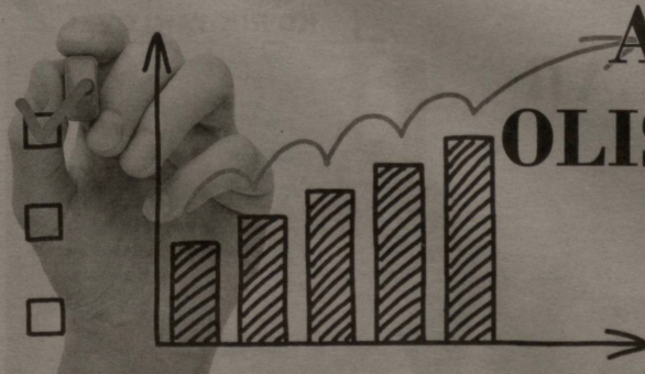
AHOLI ASOSAN QUYIDAGI MAQSADLARDA RO'YXATGA OLINADI: