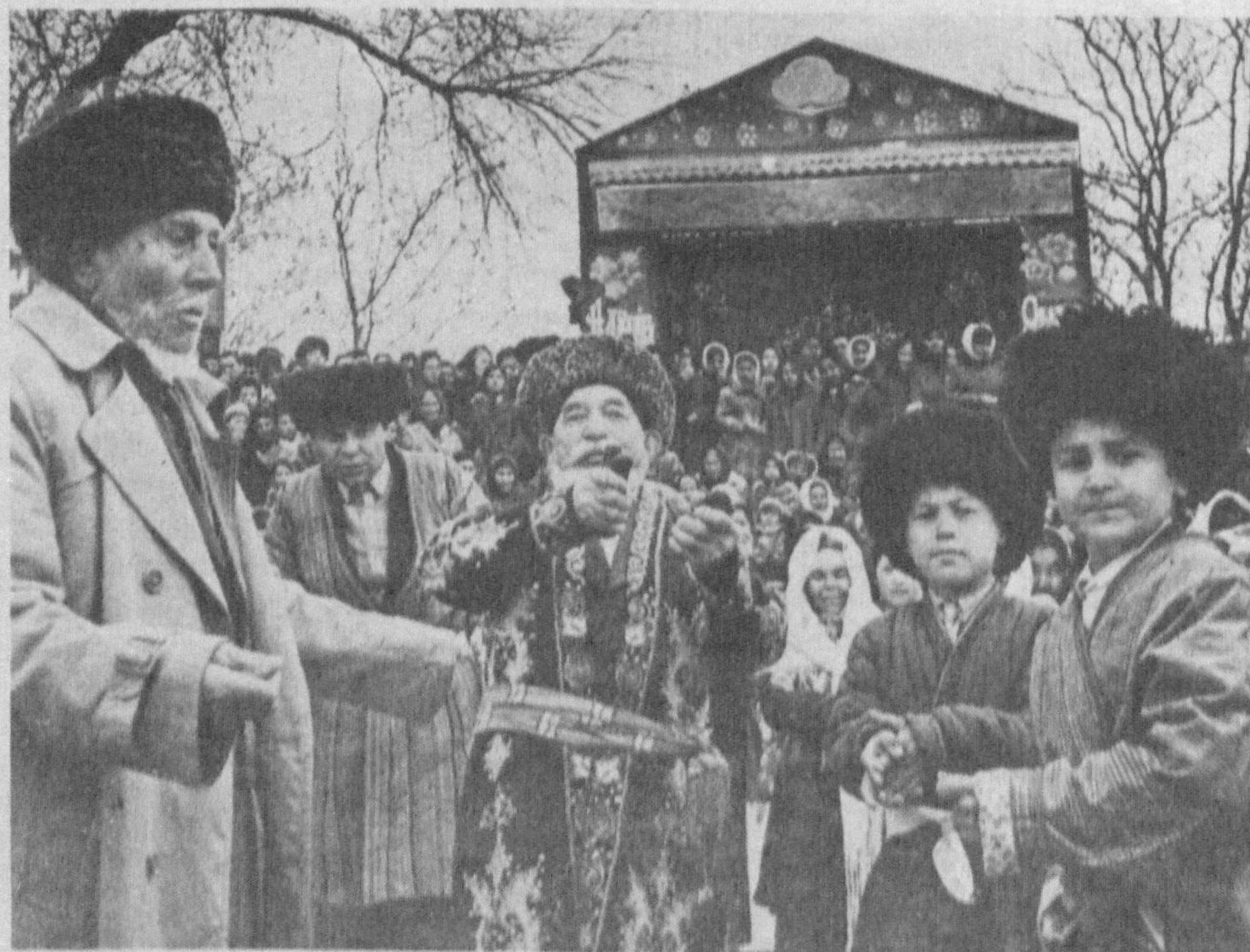
Наврўз тантаналари сурат лавҳалари муаллифи: Б. РАҲИМОВ.