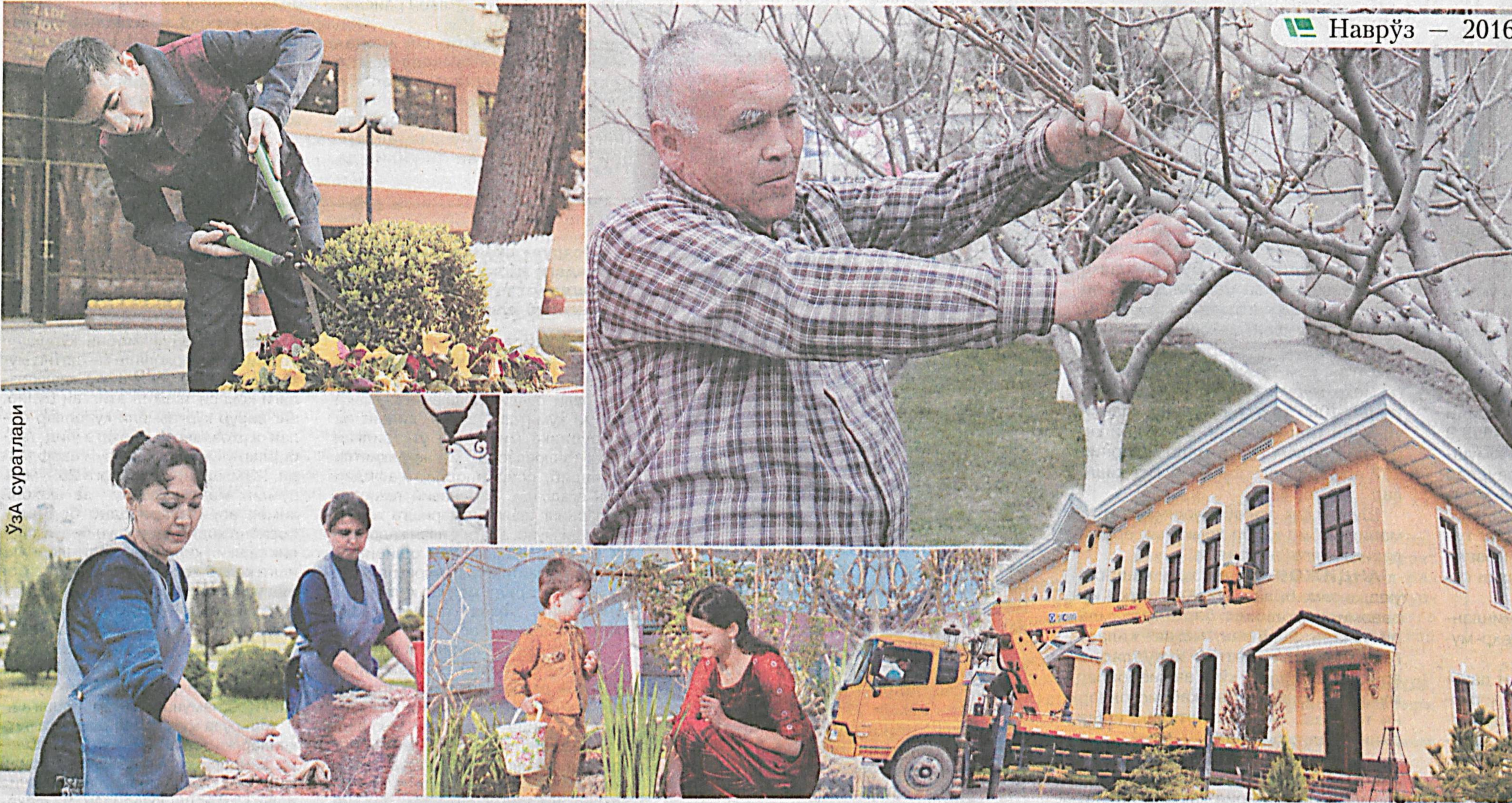
Наврўз — 2016