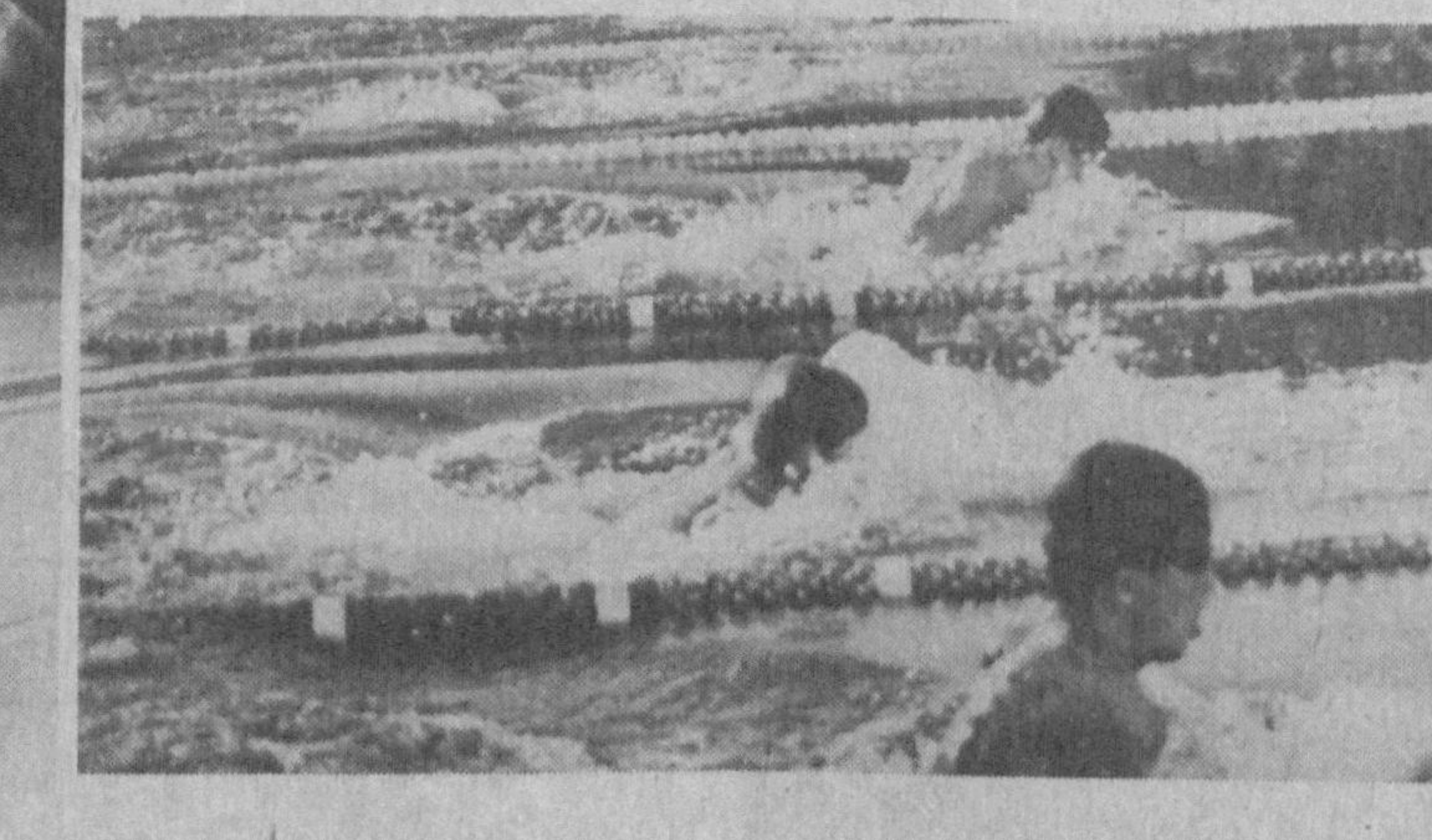
М. АМИН олган суратлар.