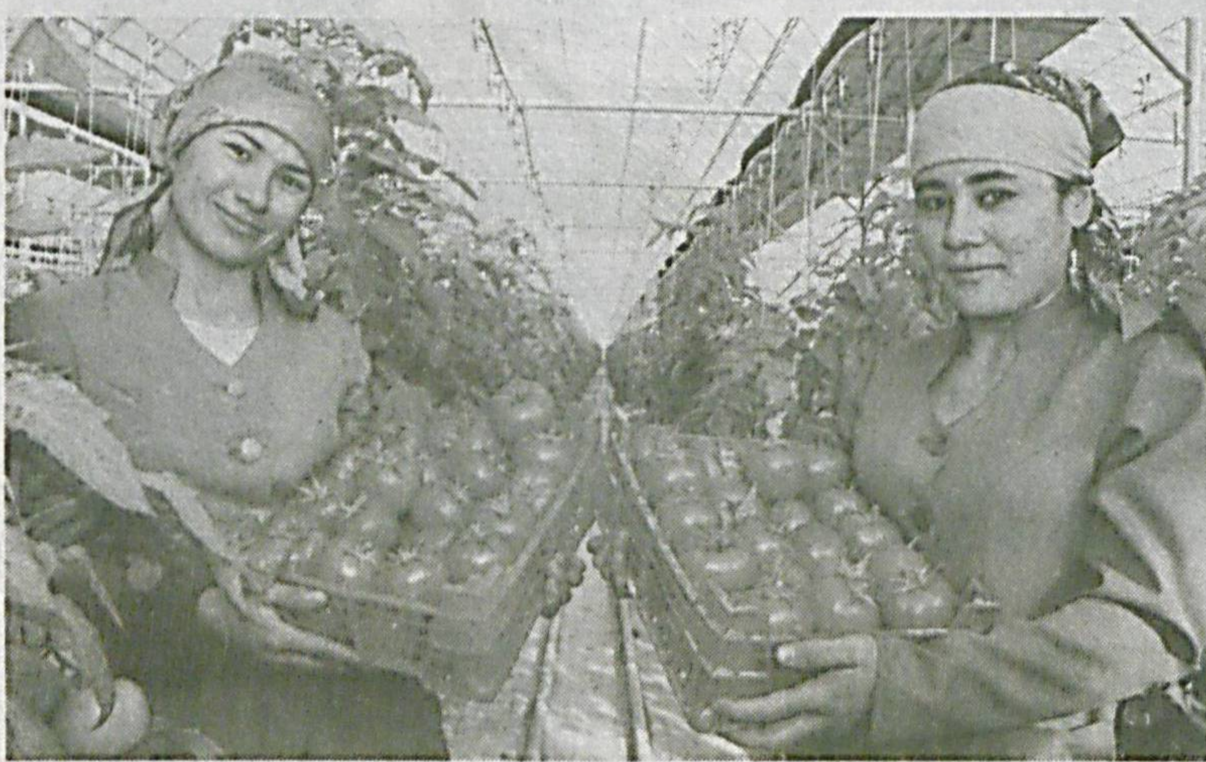
Мамлакатимиз Президентининг «Мева-сабзавот, картошка ва полиз маҳсулотларини харид қилиш ва улардан фойдаланиш тизимини такомиллаштириш чора-тадбирлари тўғрисида»ги қарори тизим тараққиётини янги босқичга олиб чиқиши, шубҳасиз.