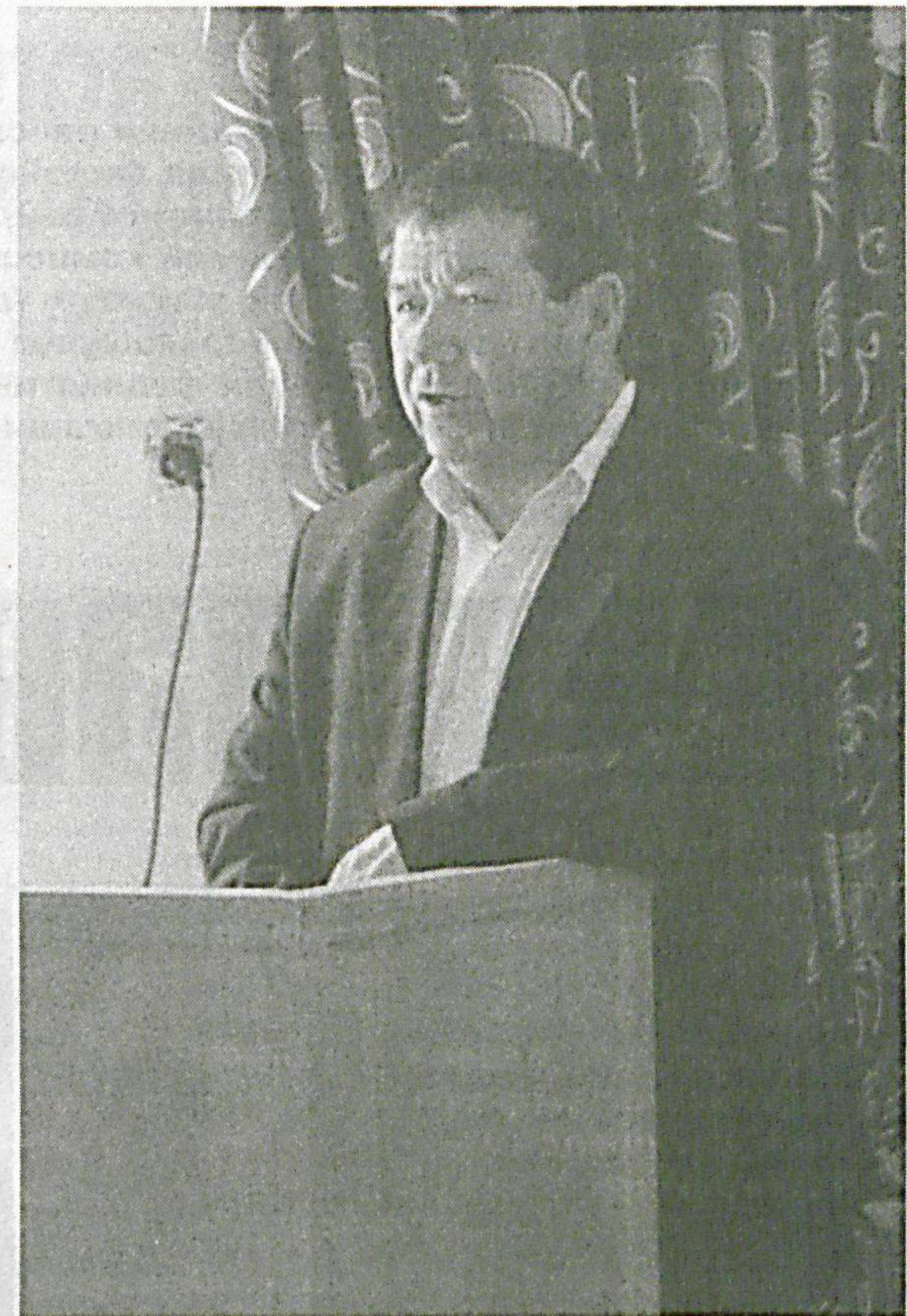
тармоқнинг ҳудудий масъул ташкилотчилари ҳамда Тошкент вилояти тармоқ туман кенгаши раислари иштирок этишди. Йиғилиш сўнггида мавзуга юзасидан тегишли қарорлар қабул қилинди.

Давронбек ОРИПОВ, «Ishonch» мухбири.