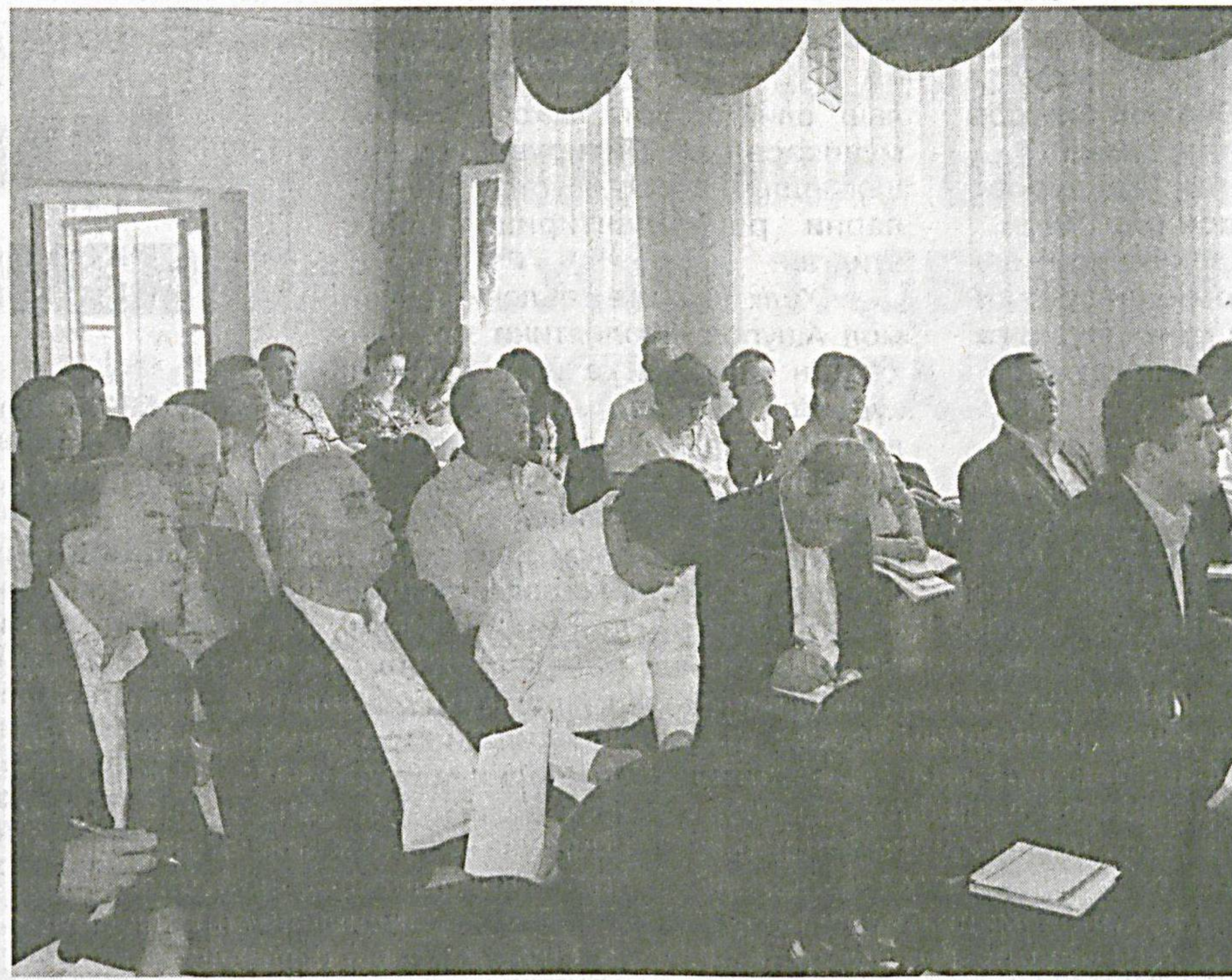
Аграсаноат мажмуи ходимлари касаба уюшмаси Республика кенгаши томонидан Ўртачирчиқ туманида ўқув-семинар ташкил этилди.