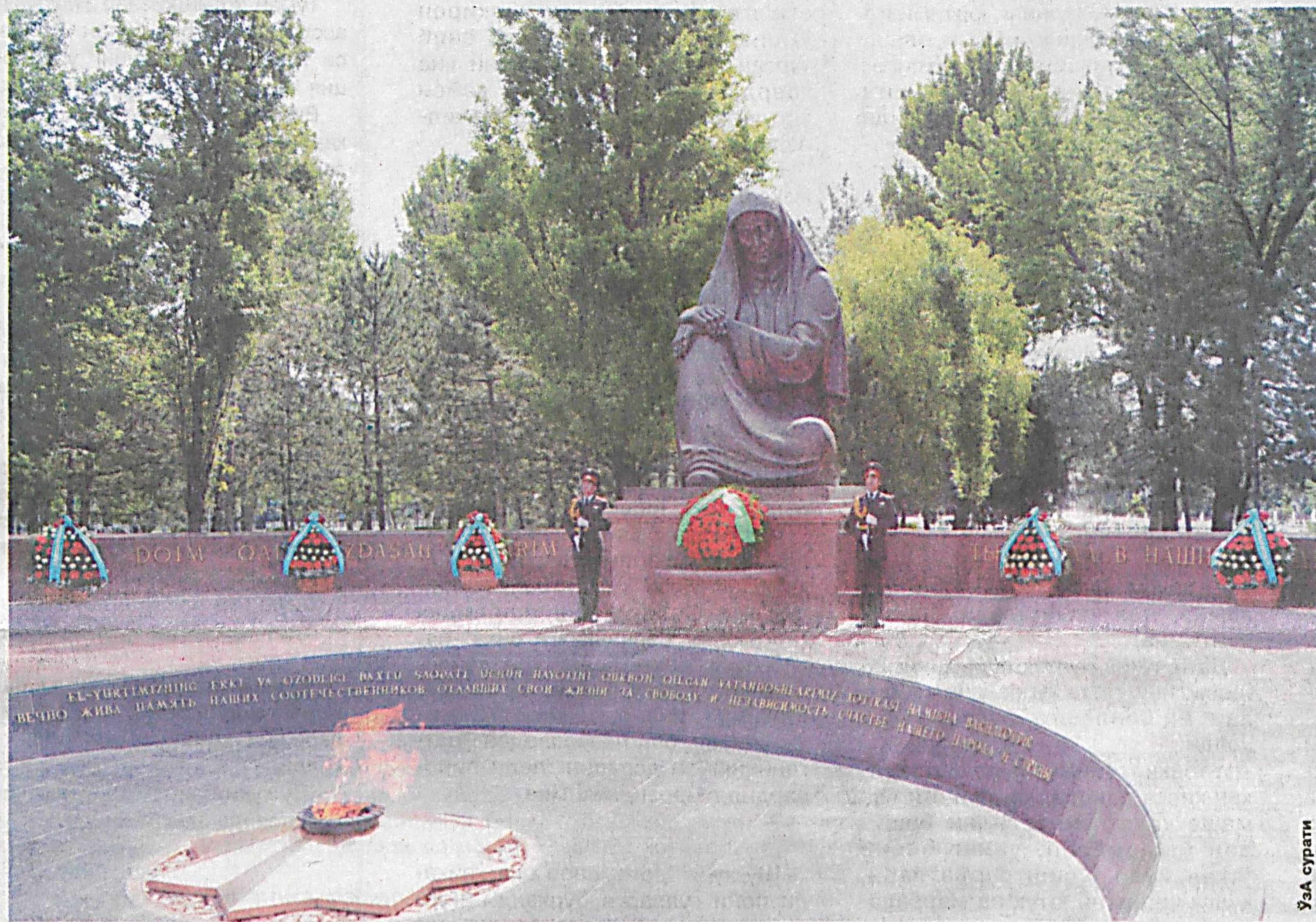
Майдони ҳар қачонгидан гавжум. Бу ерга уруш ва меҳнат фахрийлари, сенаторлар ва депутатлар, ҳукумат аъзолари, ҳарбийлар, жамоатчилик вакиллари ташриф буюрган.