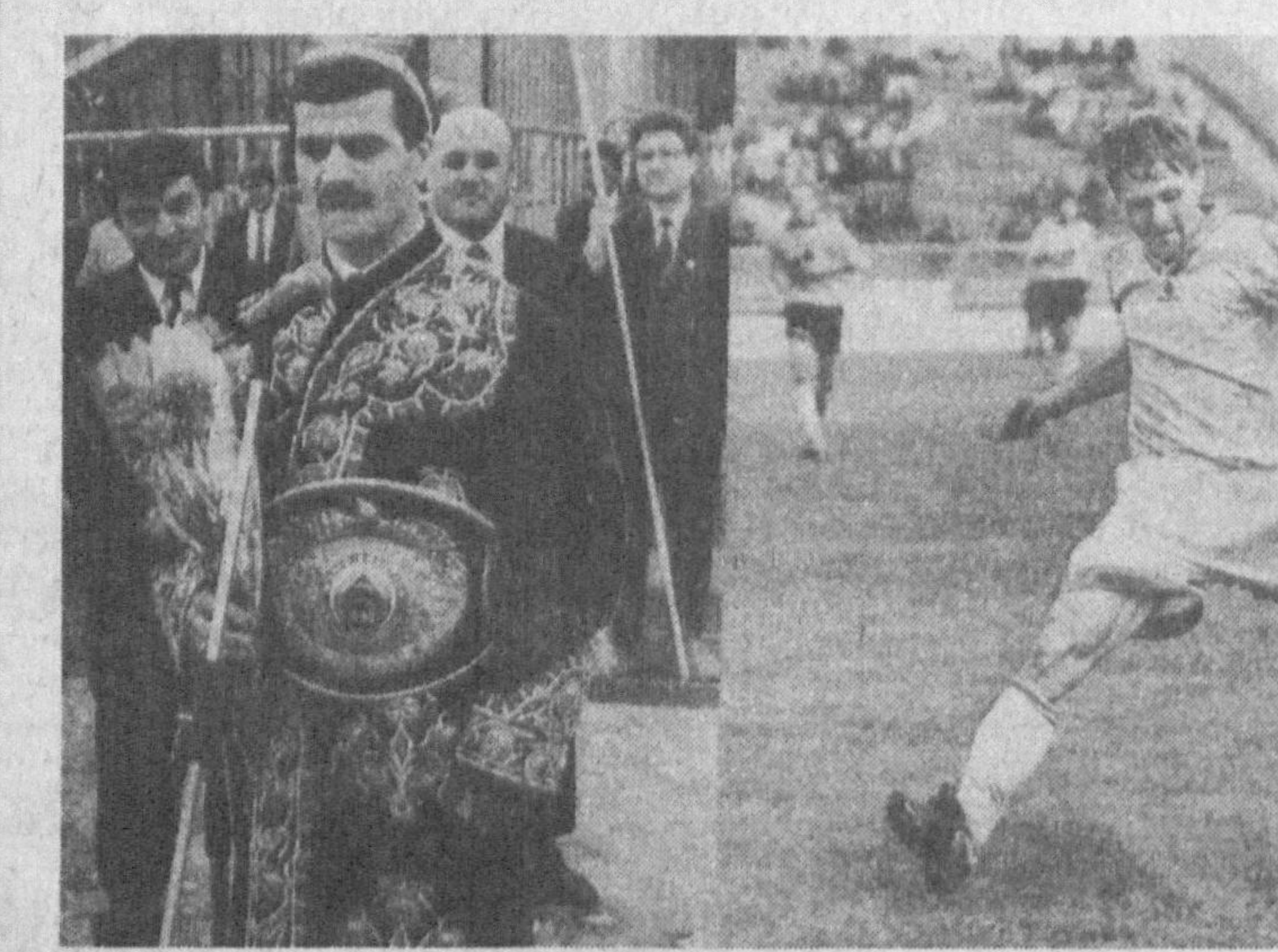
Суратларда: FIFA ва мамлакатимиз байроқлари кўтарилди, футбол мавсуми бошланди; бокс бўйича жаҳон чемпиони Артур Григорян; футболчилар; тренер ҳаяжонда.

Узбекистон Вазирилар Маҳкамасининг барча вилоятлардаги футбол ўйингоҳларини 1 апрелгача жаҳон андозалари талабига жавоб берадиган даражада таъмирлаш вазифасини кўйган эди.