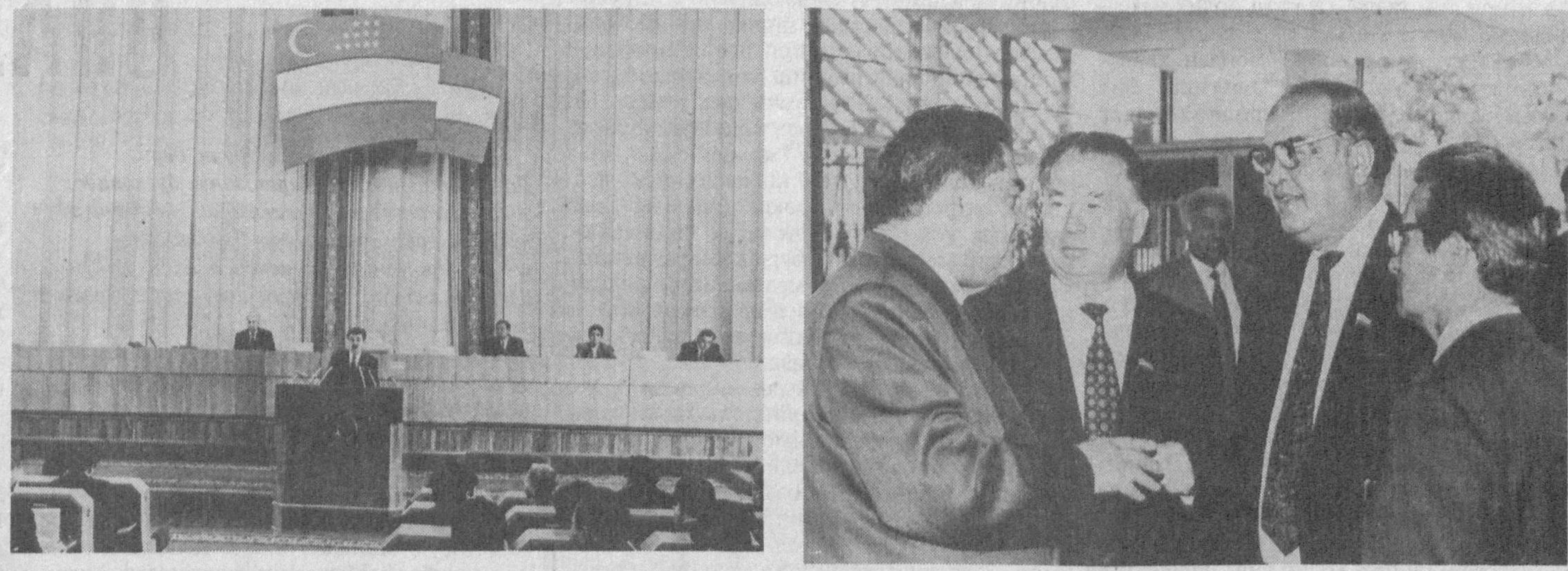
Суратларда: сессиядан лавҳалар.