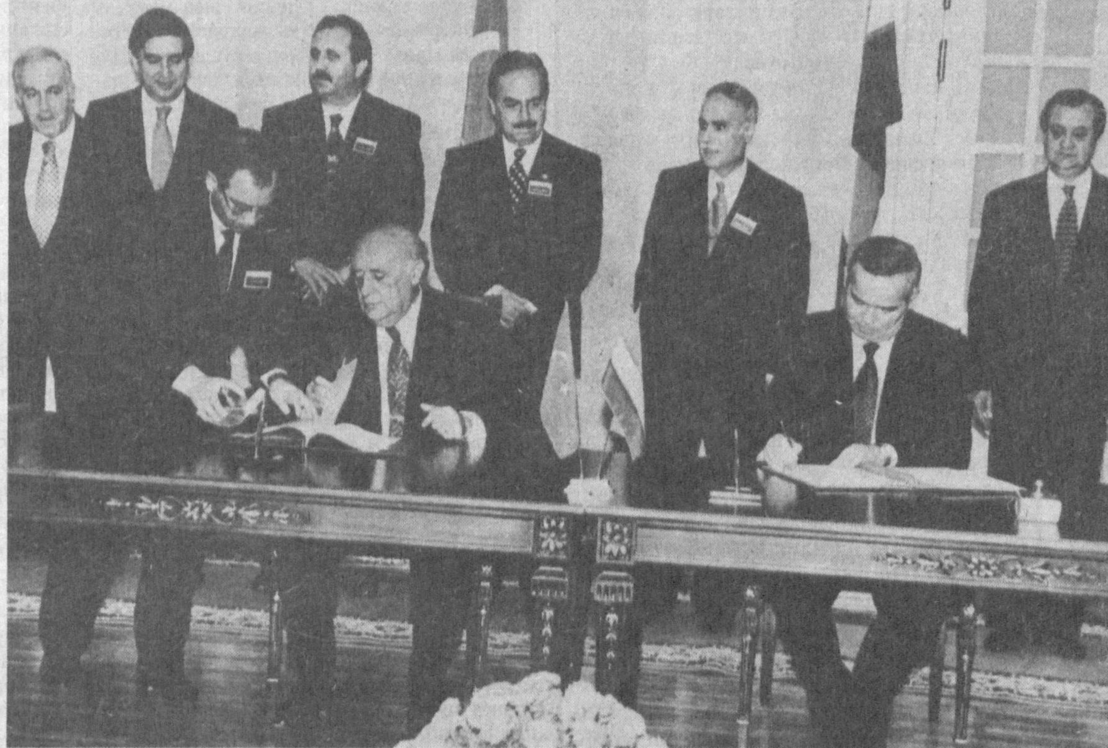
Суратда: битимларни имзолаш пайти.