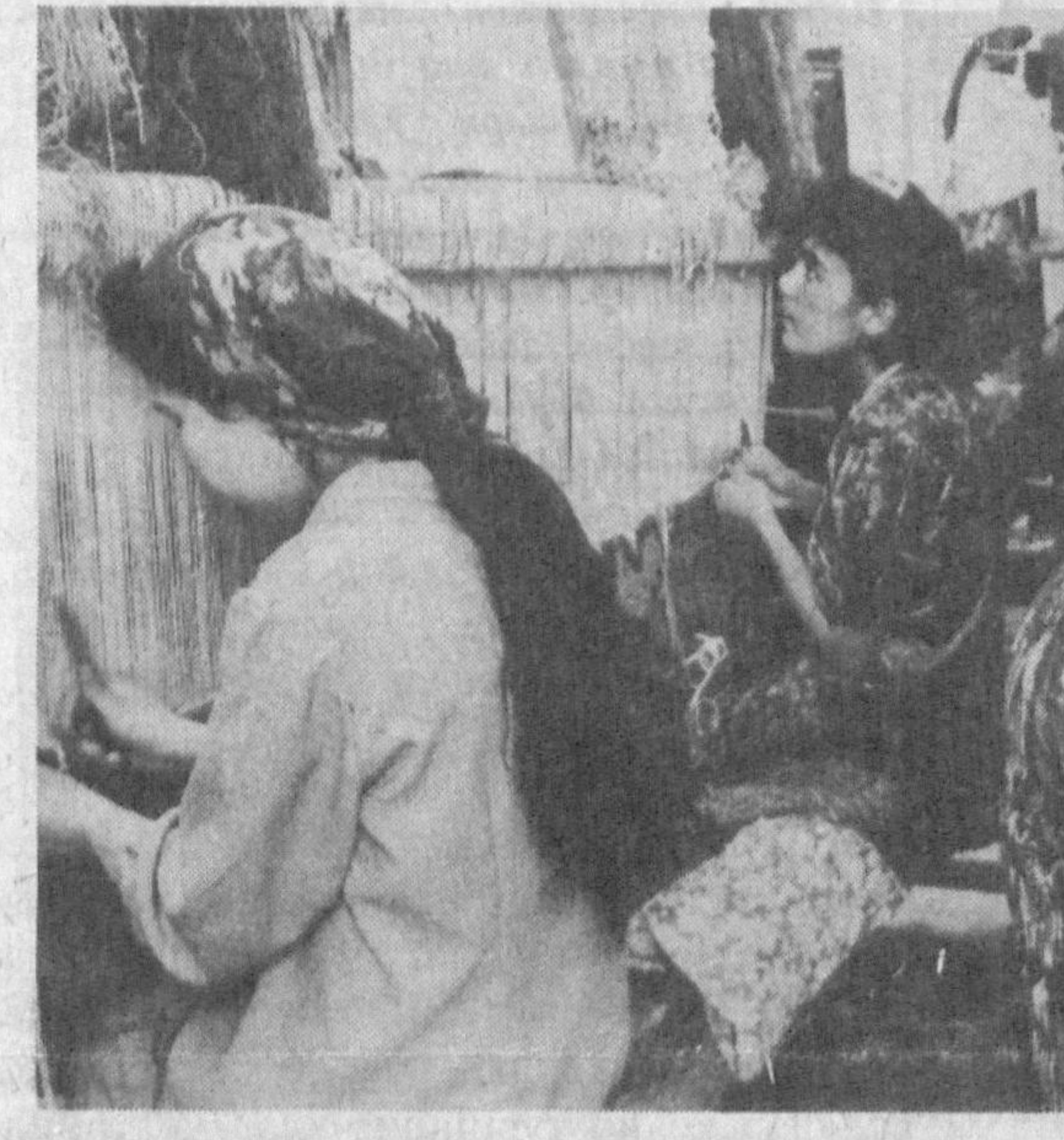
Сирдарёда: Бирлашма тукув цехининг қул гул гиламдузлари.