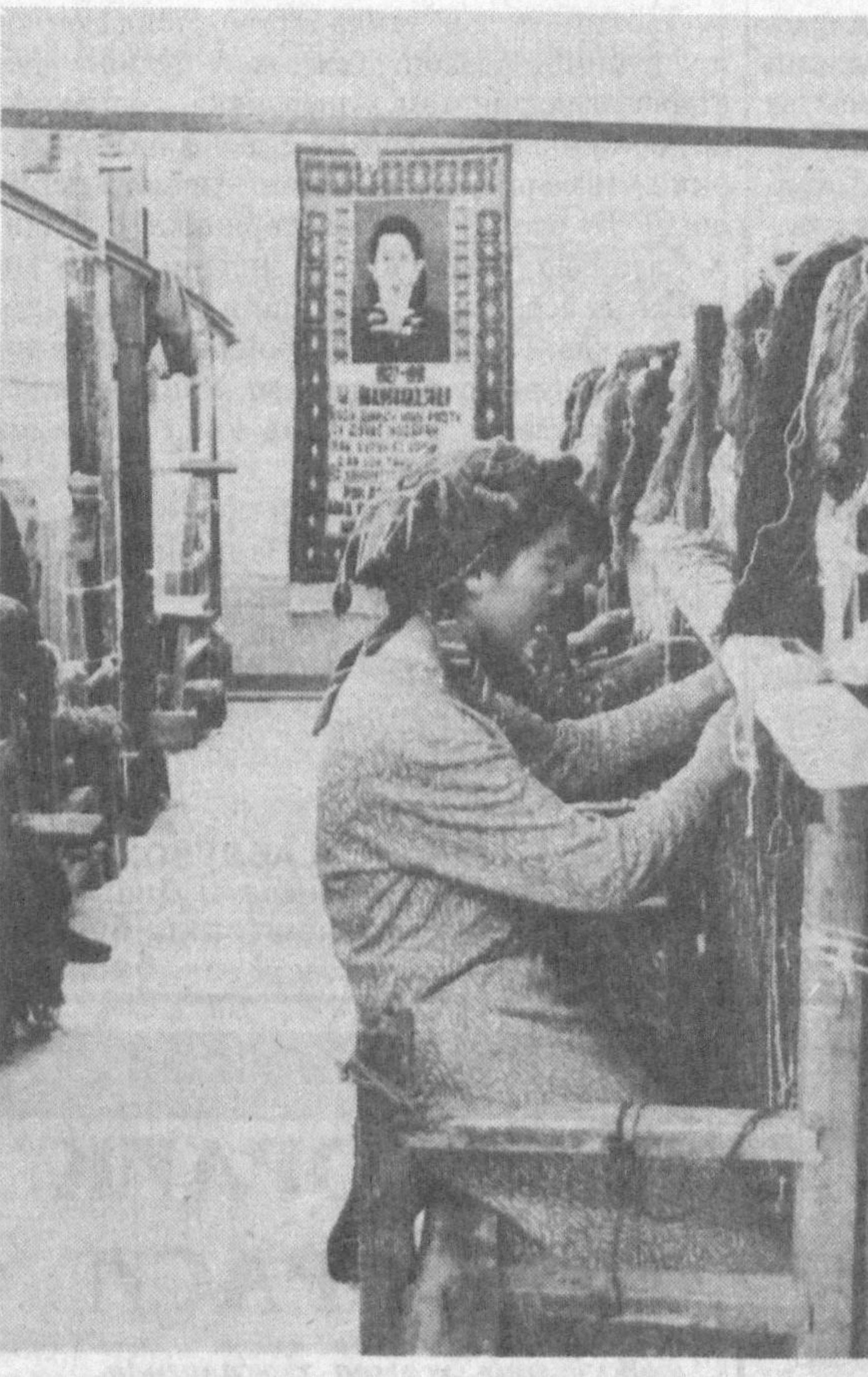
Сирдарё вилоятининг Ховос тумани марказида «Меҳнат» кооператив-ижара бирлашмаси ташкил этилганига ҳам 8 йилдан ошди. Қун тармоқли ҳужалик уттан ишлар давомиди самарали иқтисодий изланишлар натижасида ривожланишининг равон йулига чиқиб олди. Бу ерда гишт шиширувчи цех, сопол буюмлар тайёрловчи корхона ишлаб турибди. Ҳужаликнинг тadbиркор соҳиблари пахта, буғдой, мева ва сазвот ҳам етиштирмоқдалар. Эндиликда корхона қошида яна бир янги тармоқ-гилам туқиш цехи очилди. Яқин атрофдаги қишлоқларнинг эълик нафар қизлари иш билан таъминландилар. Улар туқитан гиламлар барчага манзур бўлмоқда. Қул гул тукувчилардан харидорлар айниқса мамун.