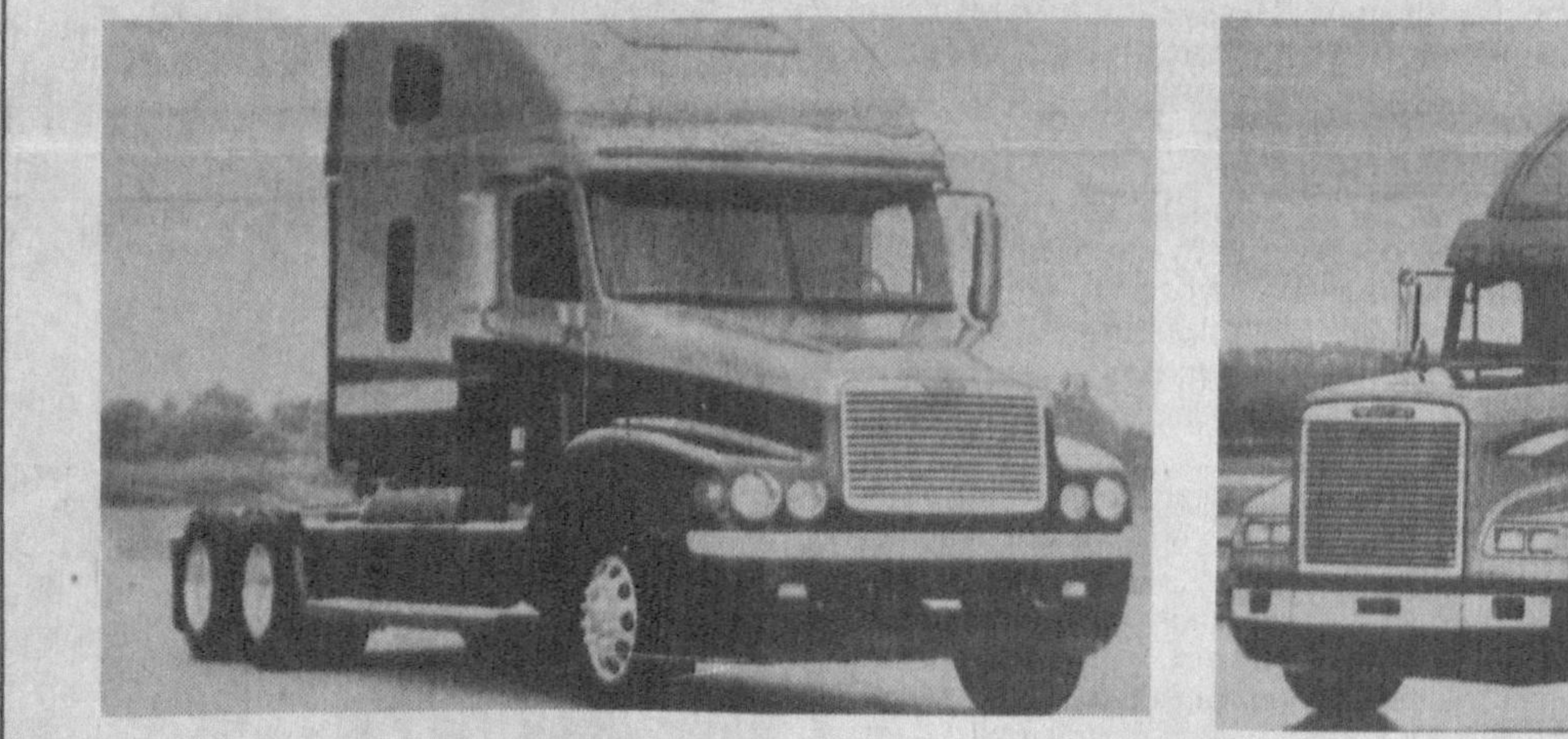
Суратларда: «Freightliner» магистрал шатак машиналарининг икки авлоди — чапда — «Century Class», унда унинг ўтмишдоши FLD.

Янги трейлер ажайиб кабинага ва уқлаш хонасига эга. Кабина орқадан 25 см кенгайтирилган, уриндик эса кабина деворларидан 8 см нарига суриб жойлаштирилган.