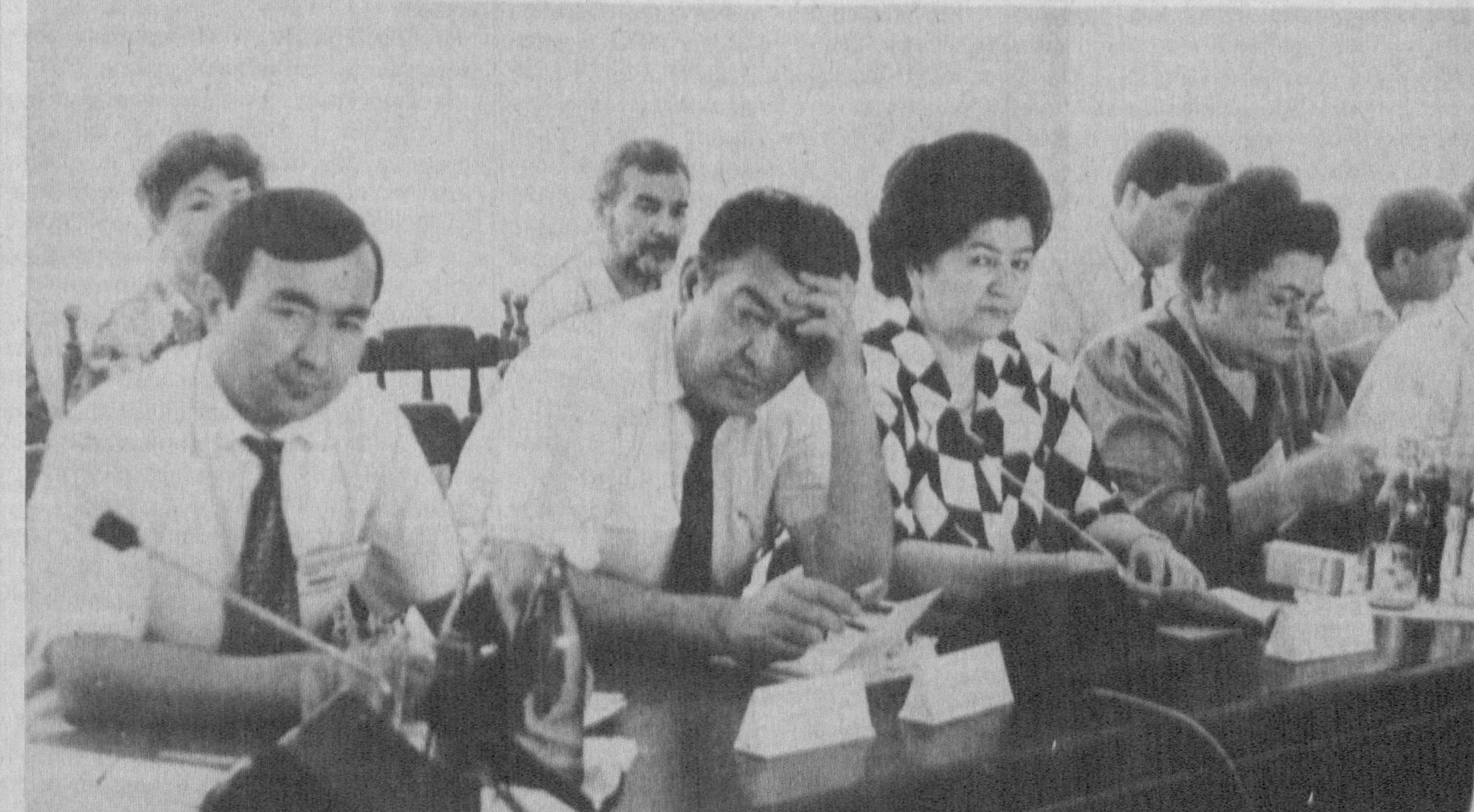
Суратларда: илмий-амалий анжумандан лавҳалар.