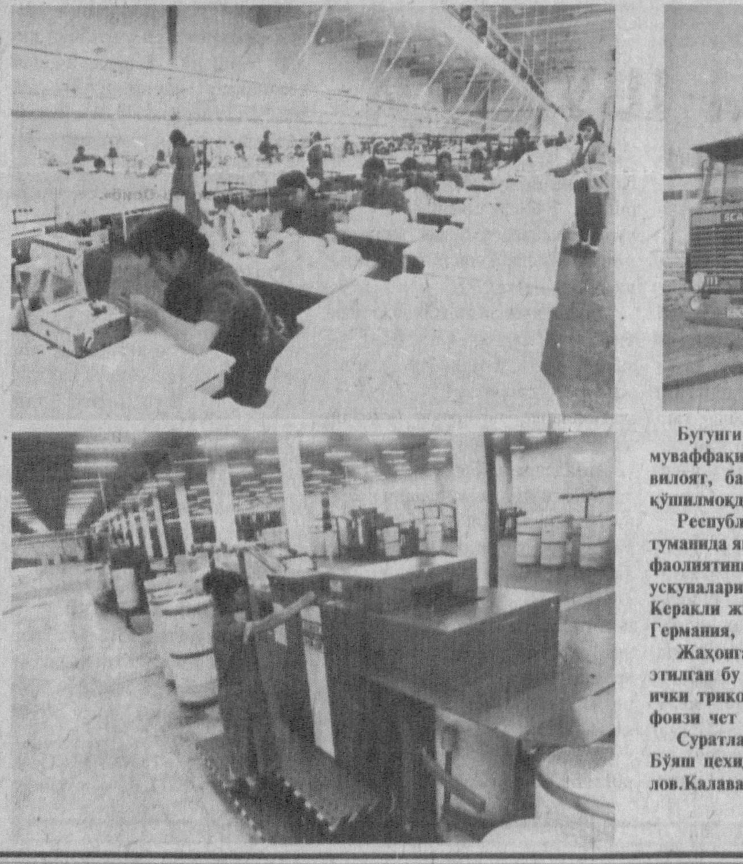
Бугунги кунда Самарқанд вилоятида ушбу қўшма корхоналар муваффақият билан фаолият юргизмоқда...