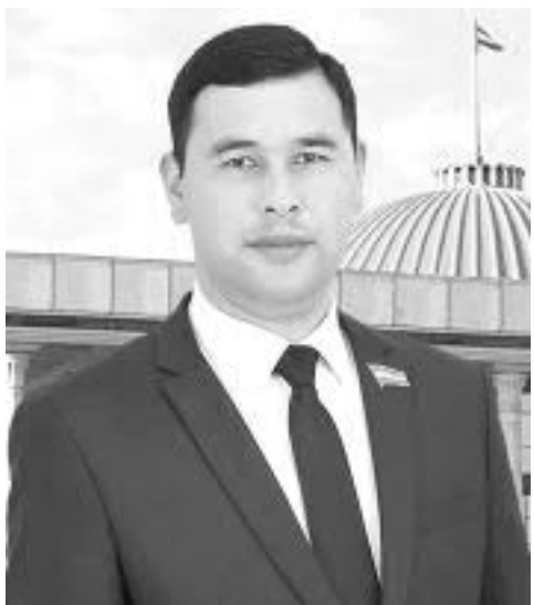
Шерзод РАҲМОНОВ, Олий Мажлис Қонунчилик палатаси депутаты, Ўзбекистон ХДП фракцияси аъзоси:

– Халқимиз билан янги Ўзбекистонга мос ва монанд, халқнинг орзу-умидларини ўзида тўлиқ муҷассам этган янгиланган Конституцияни қабул қилдик.