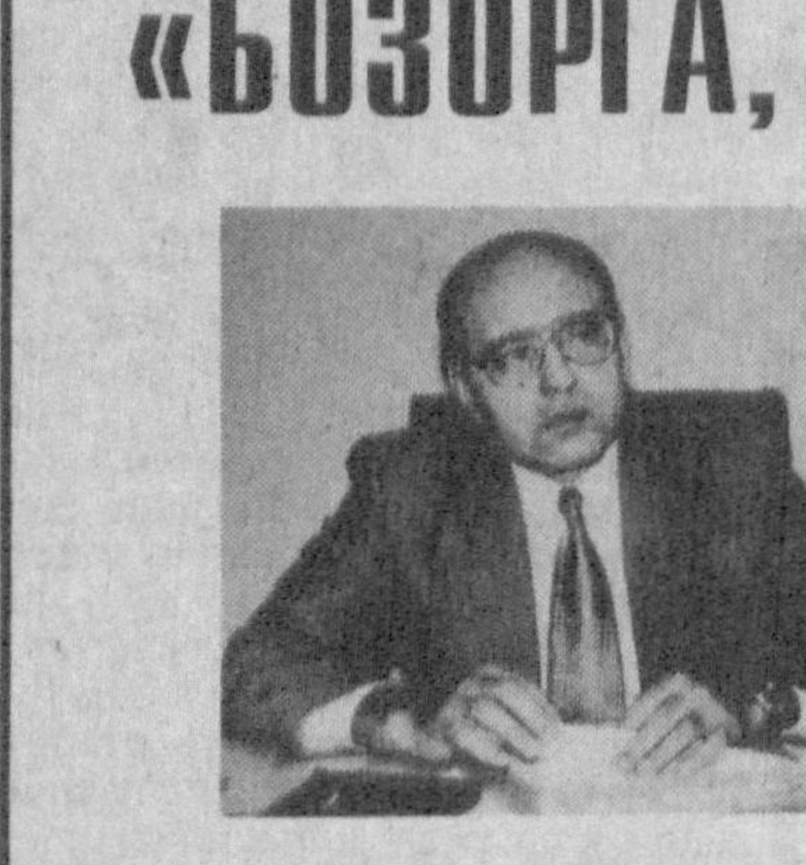
«Бугун дадил айтиш мумкинки, республика, вилоят ва ишлаб чиқариш даражасида ислохотчилар командаси, эътиқоли бир, маслаҳат қилишлар командаси шаклланда болади... Бу инсонлар учун давлат манфаатлари, иш манфаатлари, халқ манфаатлари ҳамма нарсалдан ҳам устувордир».

Рақобатни ривожлантириш кўмитаси ташқил этилди. Сунти маълумотларга қура, ҳозир республикада турқиз юздан зиёд монополист қорхона бор. Қўмитамизнинг асосий вазифаси ана шу қорхоналарнинг майдалаштириш, эркин рақобат шартинида фаолият юритишга йўл очилди иборат. Бунинг учун қўмитамиз тармоқ ва минтақа дастурини тайерламоқда. Давлат мулк кўмитаси билан биргаликда товар ва молия бозорларида рақобат муҳитини яратиш буйича ягона услубий ендашув ишлаб чиқилапти.