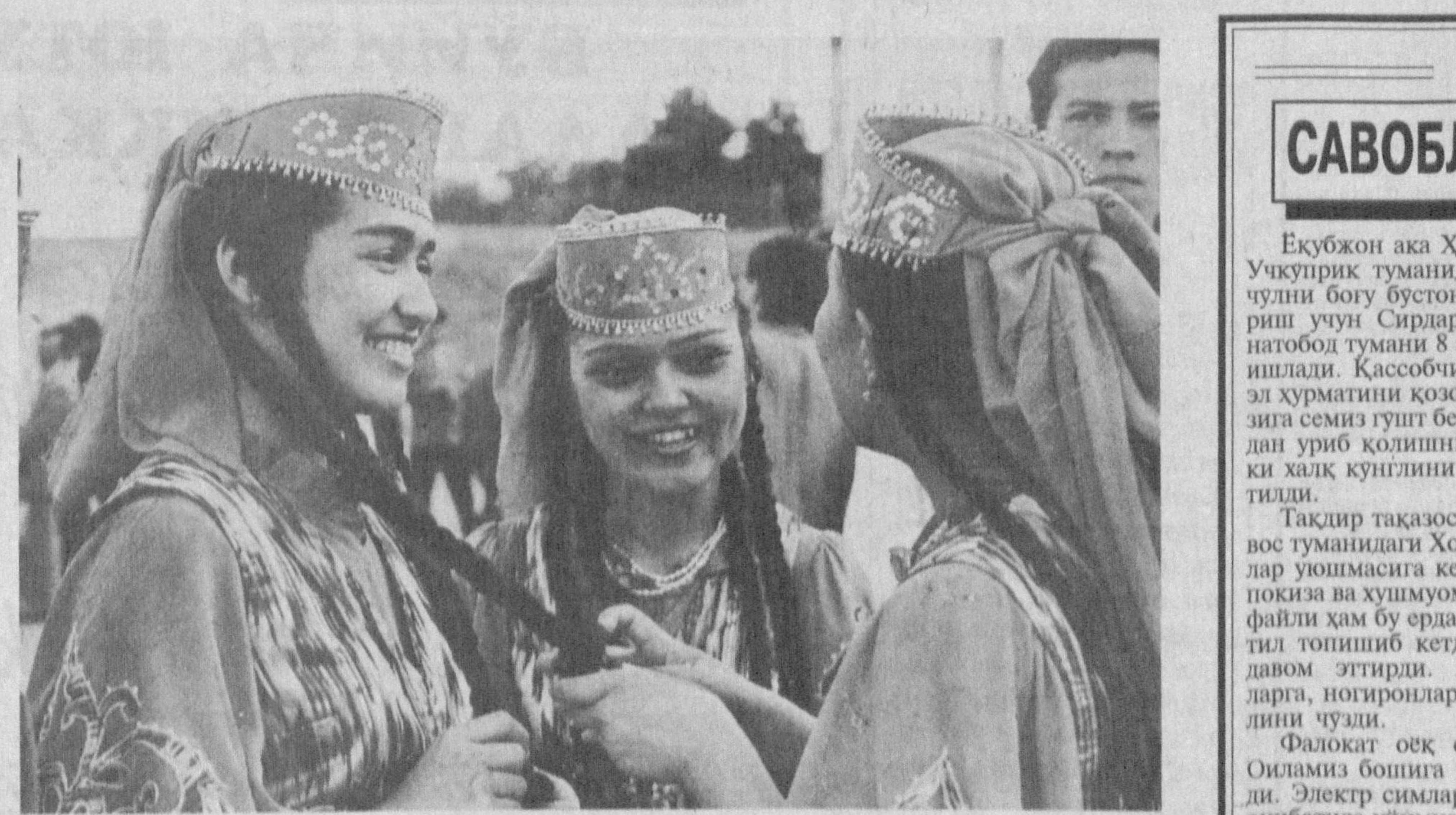
Рақса қизлар гурунги

Фориш туманидаги Сайёда қиллоқи «Богдон» ҳужалиги ҳудудида жойлашган бўлиб, қиллоқ аҳолиси қиллоқ-севаар халқ. Қиллоқнинг етти ешдан етмиш ешгача қиллоқли қиллоқ айтади, рақса тўшади, дотор ва тор чертади.