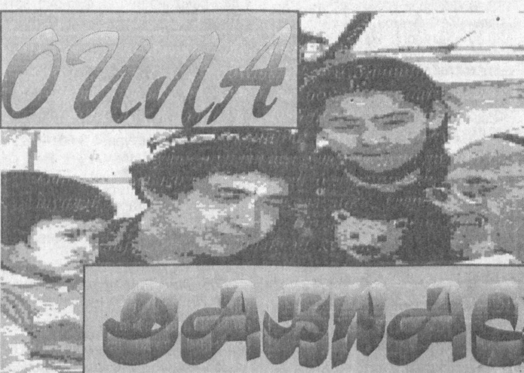
Аёл нафосатли бўлса...

Автобуста чиқдим. Не куз билан курайки, автобуснинг орқа уриндиқлари олиб ташланган. Қолган уриндиқлар эса банд. Биринки дангаса йўловчиларнинг ҳаммаси «бизнесмен»лар экан. Тўғри «ип-проформа» бориб, савдо-сотиқ қилишиб, яна шу автобуста қайтишар экан. Қизиги шундаки, шу кунг автобуста бир гуруҳ аёл «бизнесмен»лар чиққан экан. Мактабда ўқини давом эттаётганига қара-