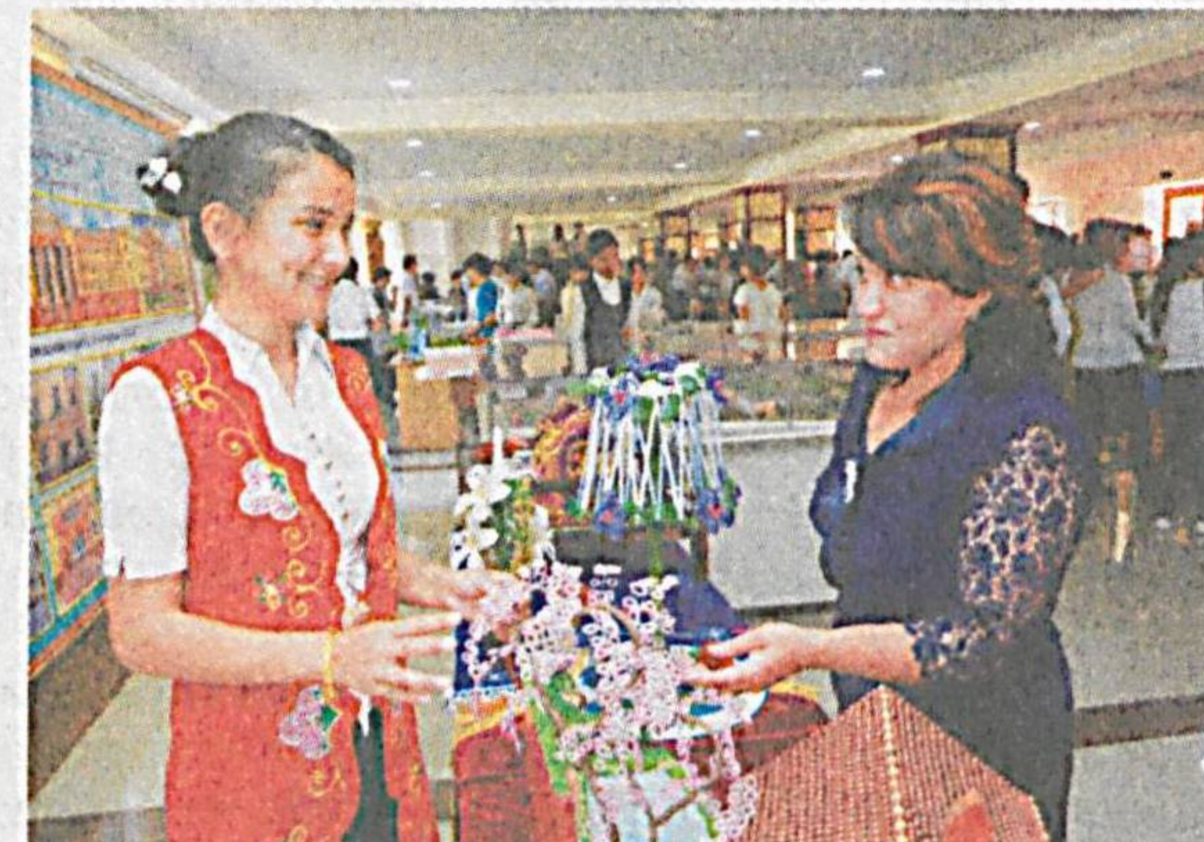
Андижон давлат университетида «Юрт келажиги» иқтидорли ёшлар танловининг вилоят босқичи ўтказилди. Унда архитектура ва дизайн, ахборот технологиялари, рационализаторлик тақлифлар ва техник ишланмалар, тасвирий ва амалий санъат, адабиёт ва публицистика йўналишлари бўйича 15-25 ёшли 594 нафар навқирон авлод вақили ижодий ишлари билан катнашди.