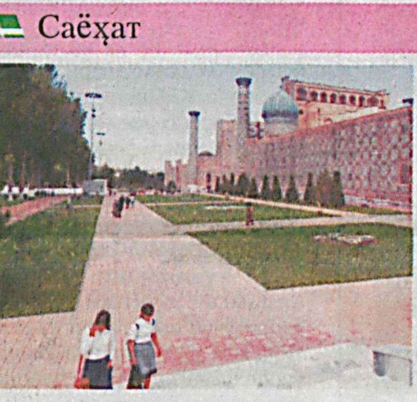
Бир гуруҳ ишчи-хизматчилар билан Самарқандга отландик. Пойтахтдаги марказий темир йўл вокзалидан «Афросиёб» теъзорар поездига ўтирдик. Кези келганда айтиш керакки, истиқлол йил-