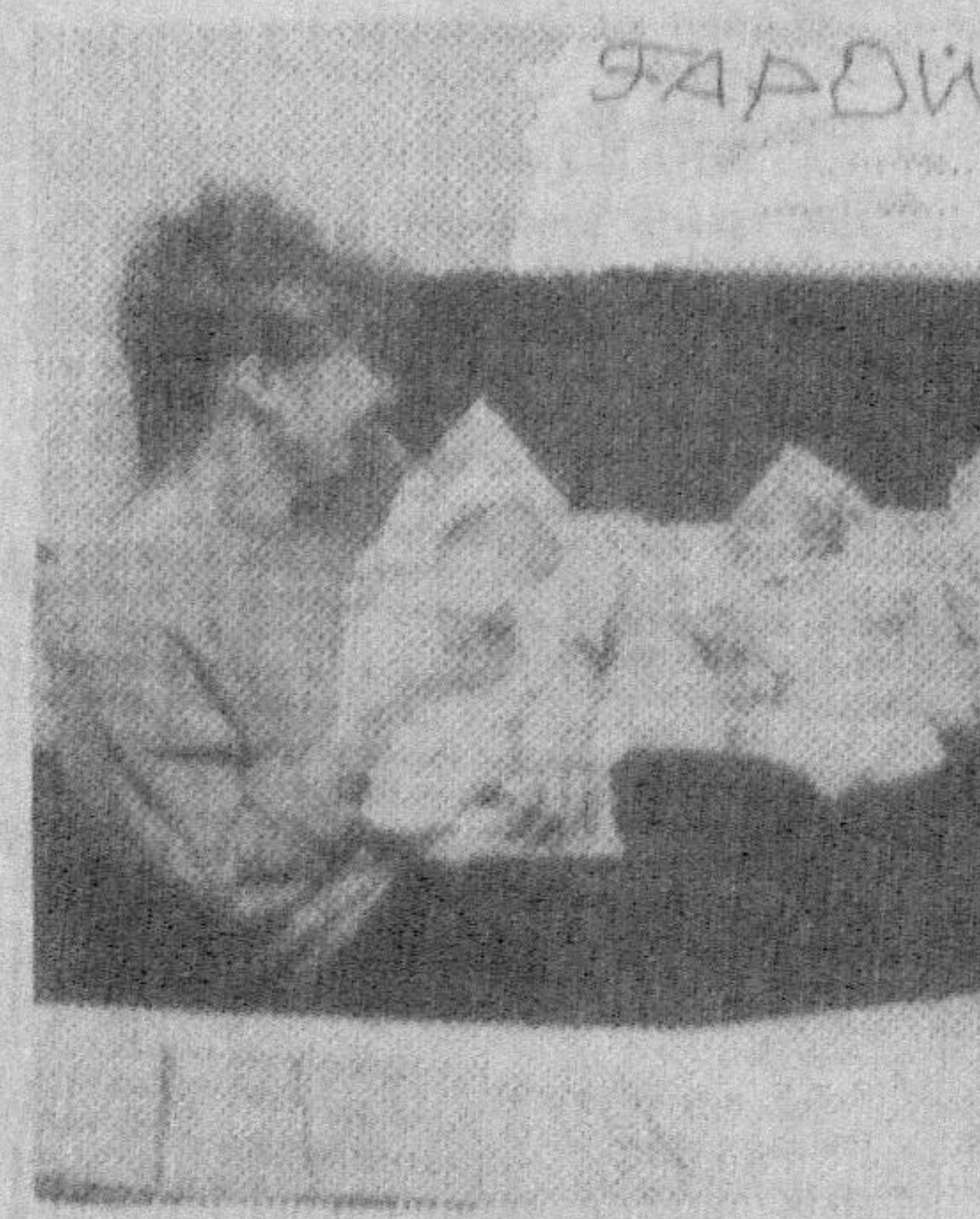
Озод БЕК тайёрлади.

Сиз суратда кўриб турган польшалик эр-хотин Банко бирданга 5 та фарангча ота-она бўлишди. Бундай хол биринчи марта бўлаётгани йўқ. Дунёда ҳозирги кунда эгизак фарангд курашлар кўпайиб қолган. Лекин, шўниси қизиқки мўтаассислар ҳалигача қандай ҳолда бирланга 5-6 та фарангч дунёга келишини аниқлаб олишмади. Ўйна бўлганда, бу эрув жаҳонда шўрини шакар болақонлар кўп бўлиши!