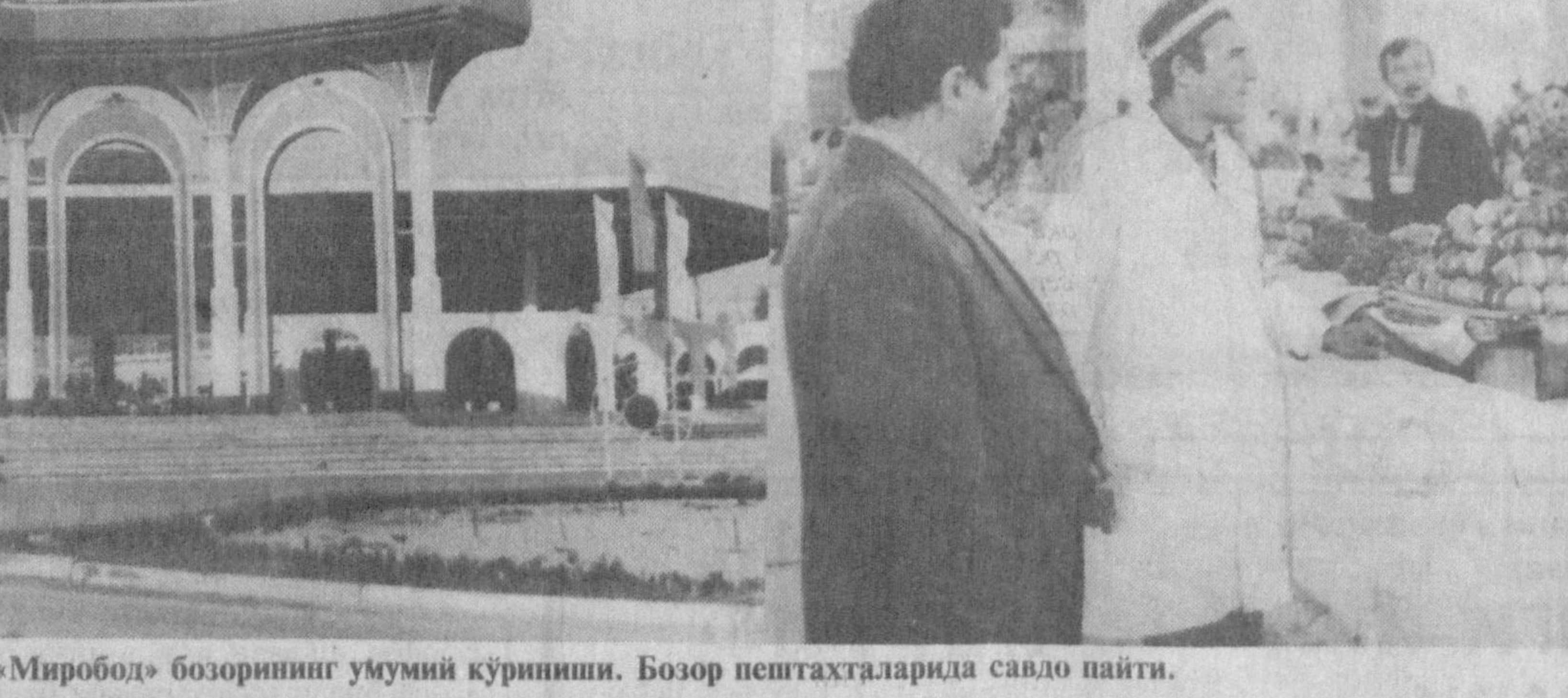
Суратларда: Тошкент шаҳридаги «Миробод» бозорининг умумий кўриниши. Бозор пептахталарида савдо пайти.