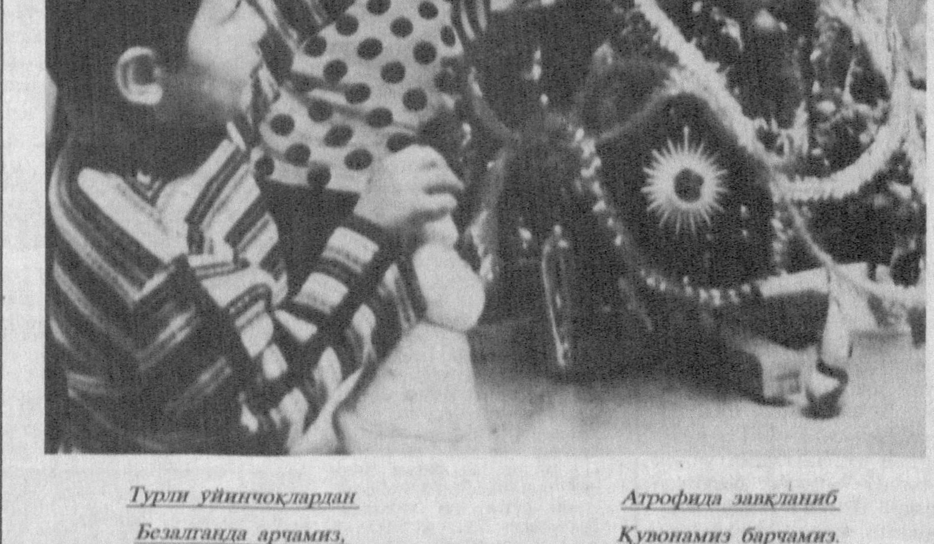
Агрофида занқилиниб Кўпонамиз барчамиз.