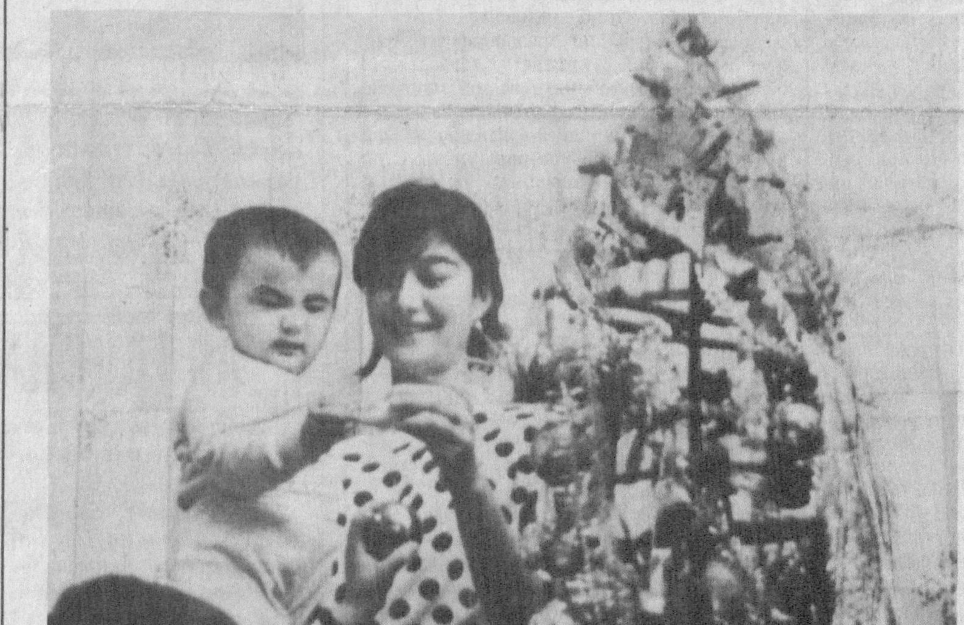
Тури уйинчоқлардан Безалганда арчамиз.