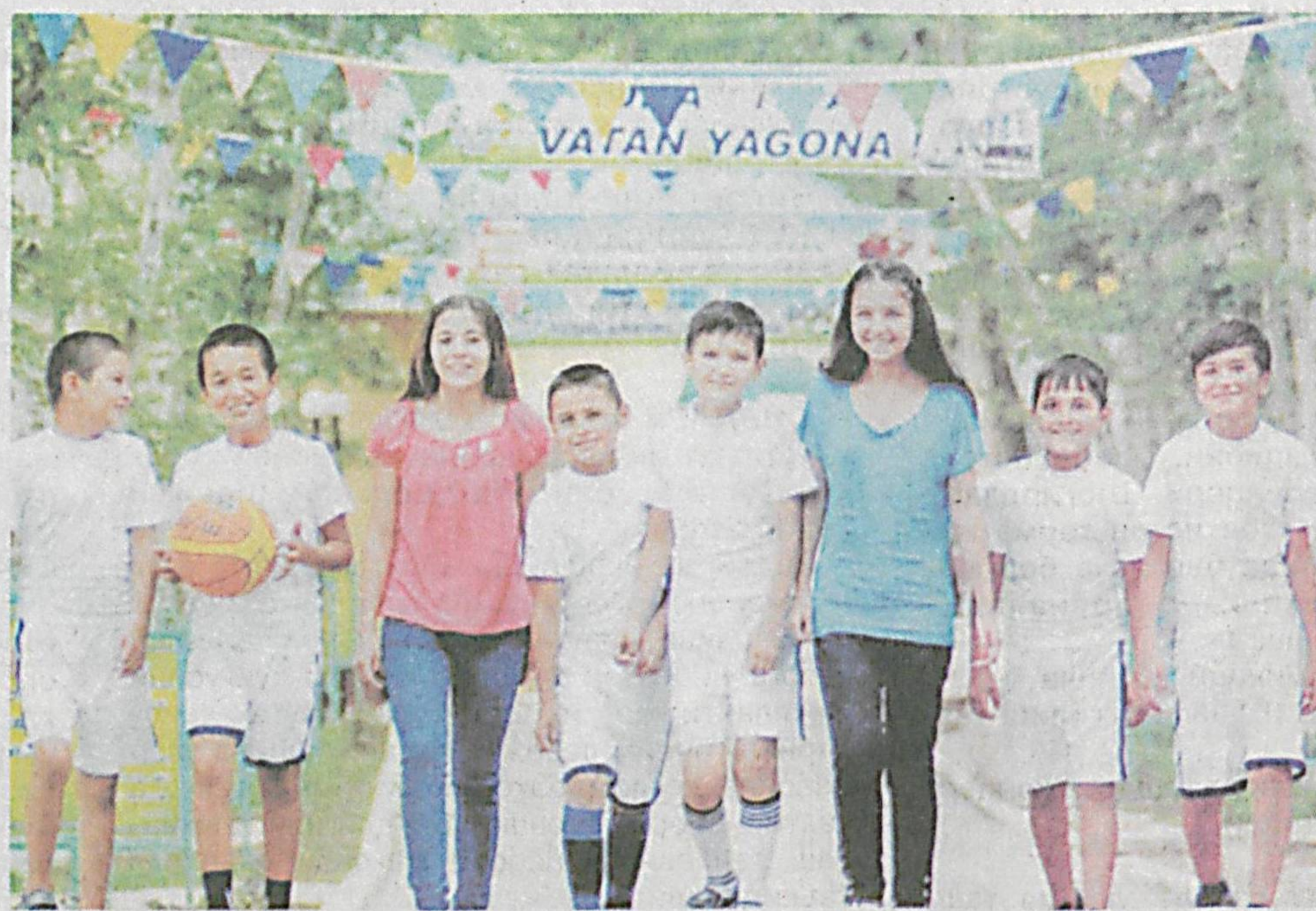
Ватан йўналишида болаларнинг дам олишини ташкил этиш ва соғломлаштириш чоратadbirlarini ишлаб чиқиш, уларни амалга ошириш юзасидан тизимли назорат ва мониторингинг таъминлаш бўйича Республика Мувофиқлаштирувчи гуруҳи негизда бир қатор вазирлик ва идоралар мутасаддиликда тузилган Ишчи гуруҳлари ўз фаолият йўналишларидан келиб чиққан ҳолда аниқ вазифаларни амалга оширди.

Мавсумда эҳтиётиманд оилалар фарзандлари, «Меҳрибонлик» уйлари тарбияланувчилари ва турли соҳаларда меҳнат қилаётган ижтимоий ҳимоятлаб ходимлар фарзандларини имтиёзли соғломлаштиришга алоҳида эътибор қаратишмоқда. Мамлакатимизда олиб борилаётган қўли ижтимоий ҳимоя сис-темаси натижасида жорий йилда режадаги 292 минг нафардан ортиқ боланинг деярли барчаси имтиёзли соғломлаштирилди. Чунки, ишловчи ота-оналар ўзлари меҳнат қилаётган корхона,