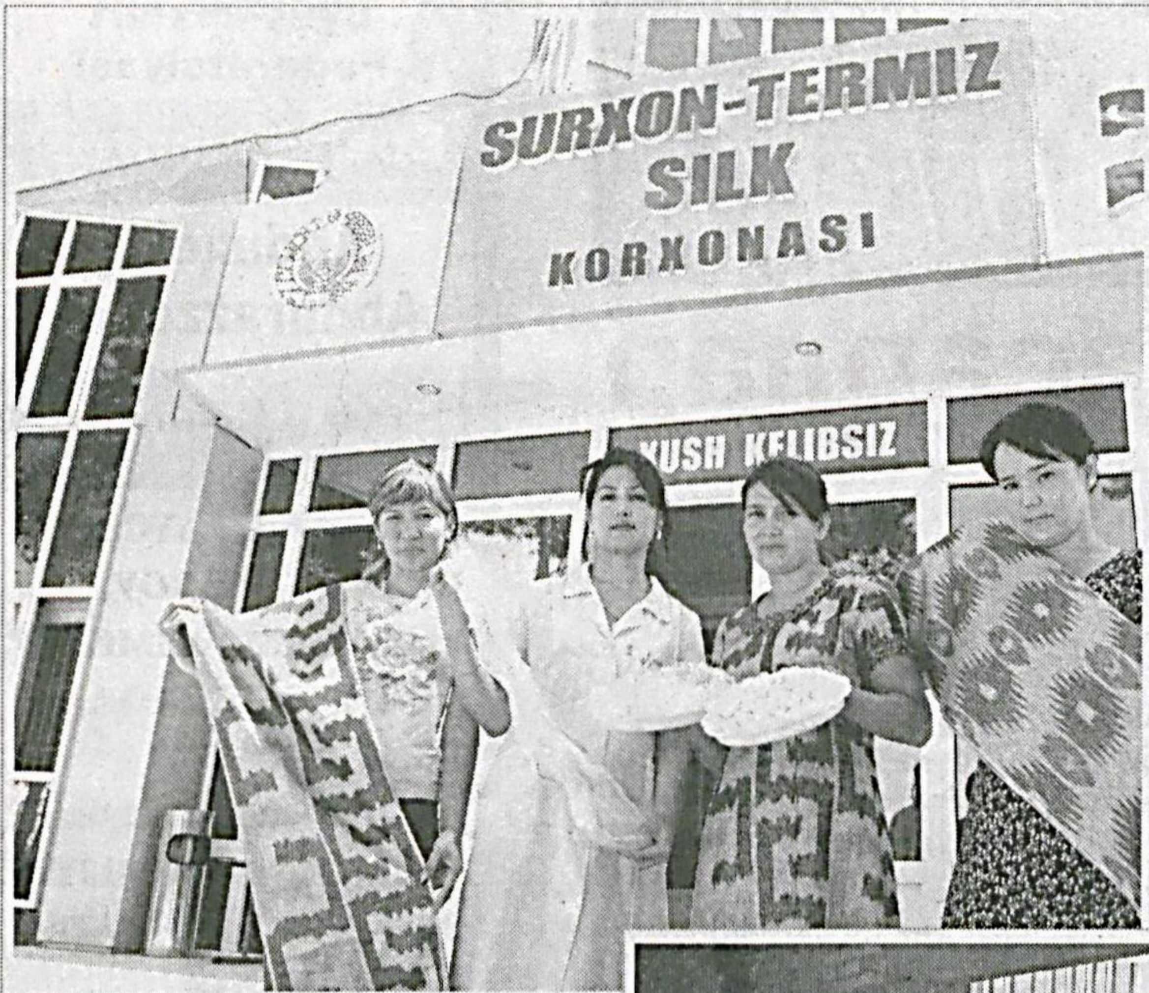
SURXON-TERMIZ SILK KORXONASI

Термиз шаҳрига ташир буюрган киши ўзига хос меъморий ечимга эга бўлган муҳташам иморатлар қад ростлаётганига гувоҳ бўлади. Сабаби — барпо этилаётган кўп қаватли уй-жойлар лойиҳаси халқимизнинг ўзига хос менталитетга мос равишда ишлаб чиқилаётди.