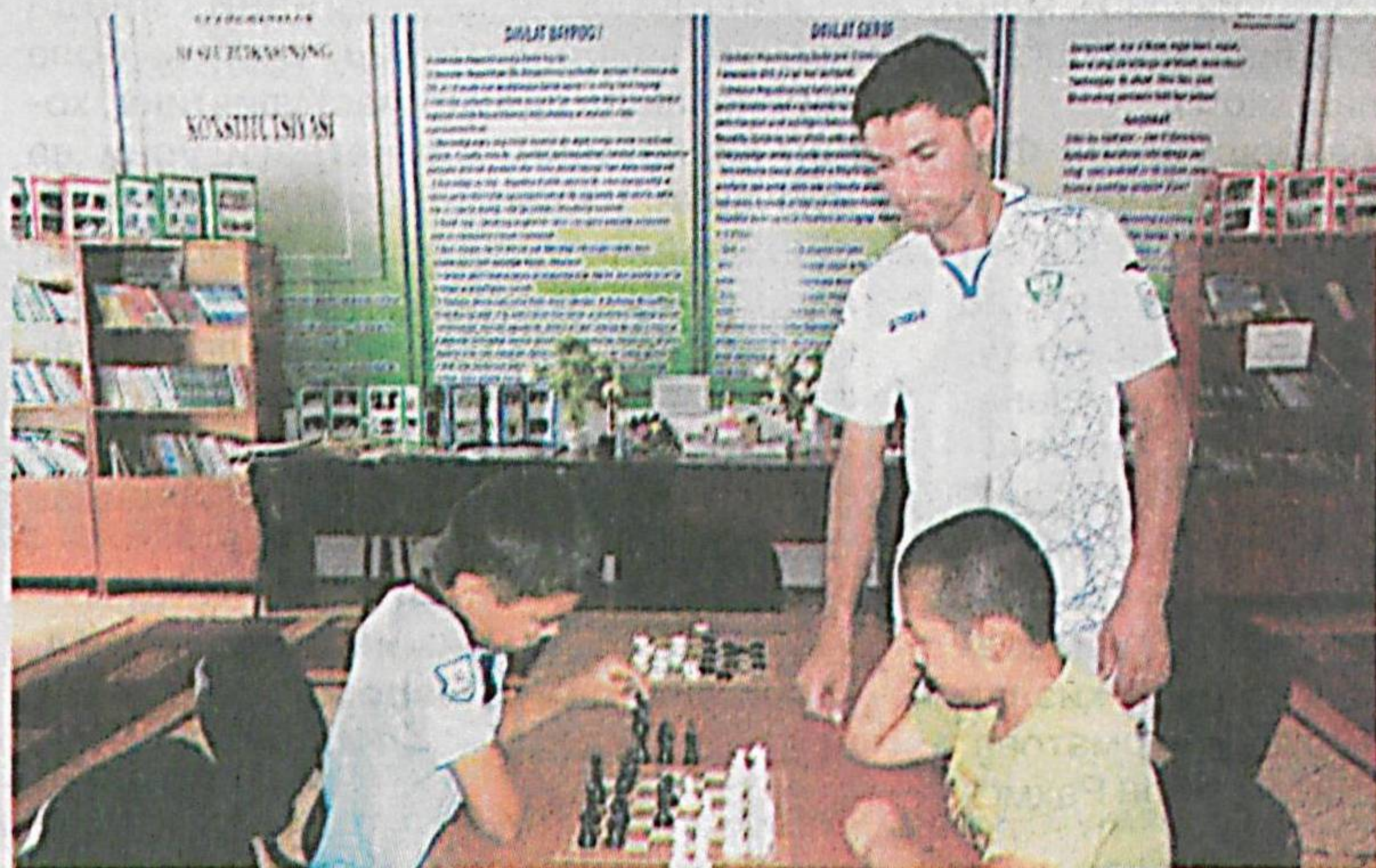
чиш-тиқиш ва турли спорт турғараклари эса ўғил-қизларнинг хунар ўрганиши, билим ва кўникмаларини

1500 та китоб фондига эга кутубхонага кирган одамнинг қиққиси келмайди. Компютер сабоқлари, би-