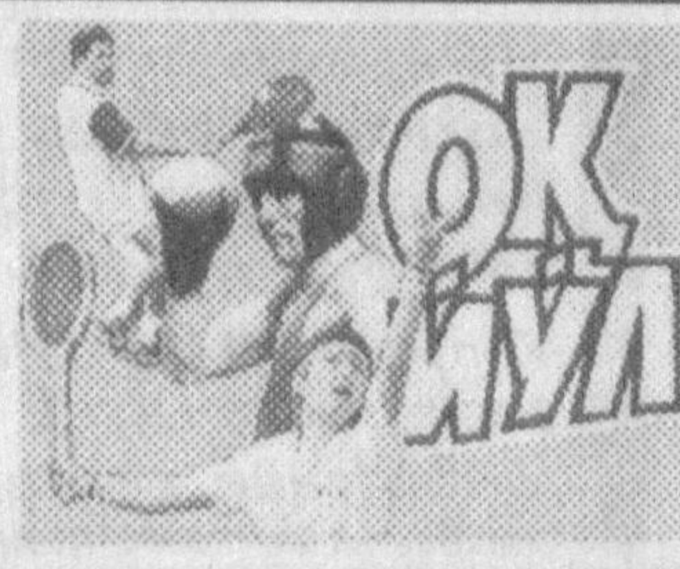
Эртага Алматыда бошланадиган II Марказий Осий ўйинларида юртимиз шарафини химоя қилиш учун спортчиларимиз жўнаб кетишади. 4-саҳифада шу ҳақда ўқийсиз.

АслоМ АҚБАРОВ, «Жаҳон» ахбороти агентлиги.