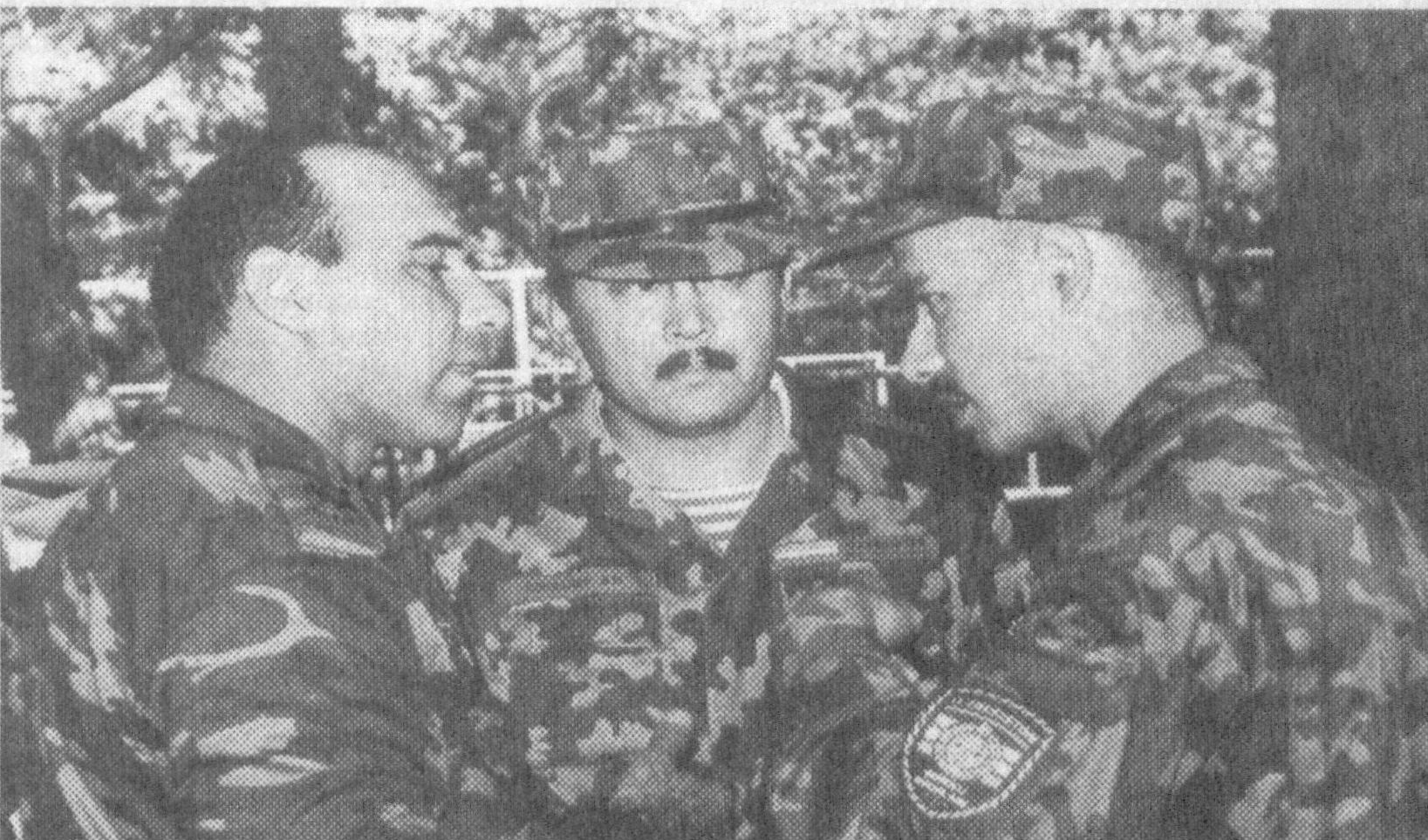
Ўзбекистон ҳудудидида шу кунларда кўп миллатли кучларнинг НАТОнинг «Тинчлик йўлида ҳамкорлик» дастури доирасига кирувчи «Марказий Осиё» батальони-97» дала машқлари бўлиб ўтмоқда.