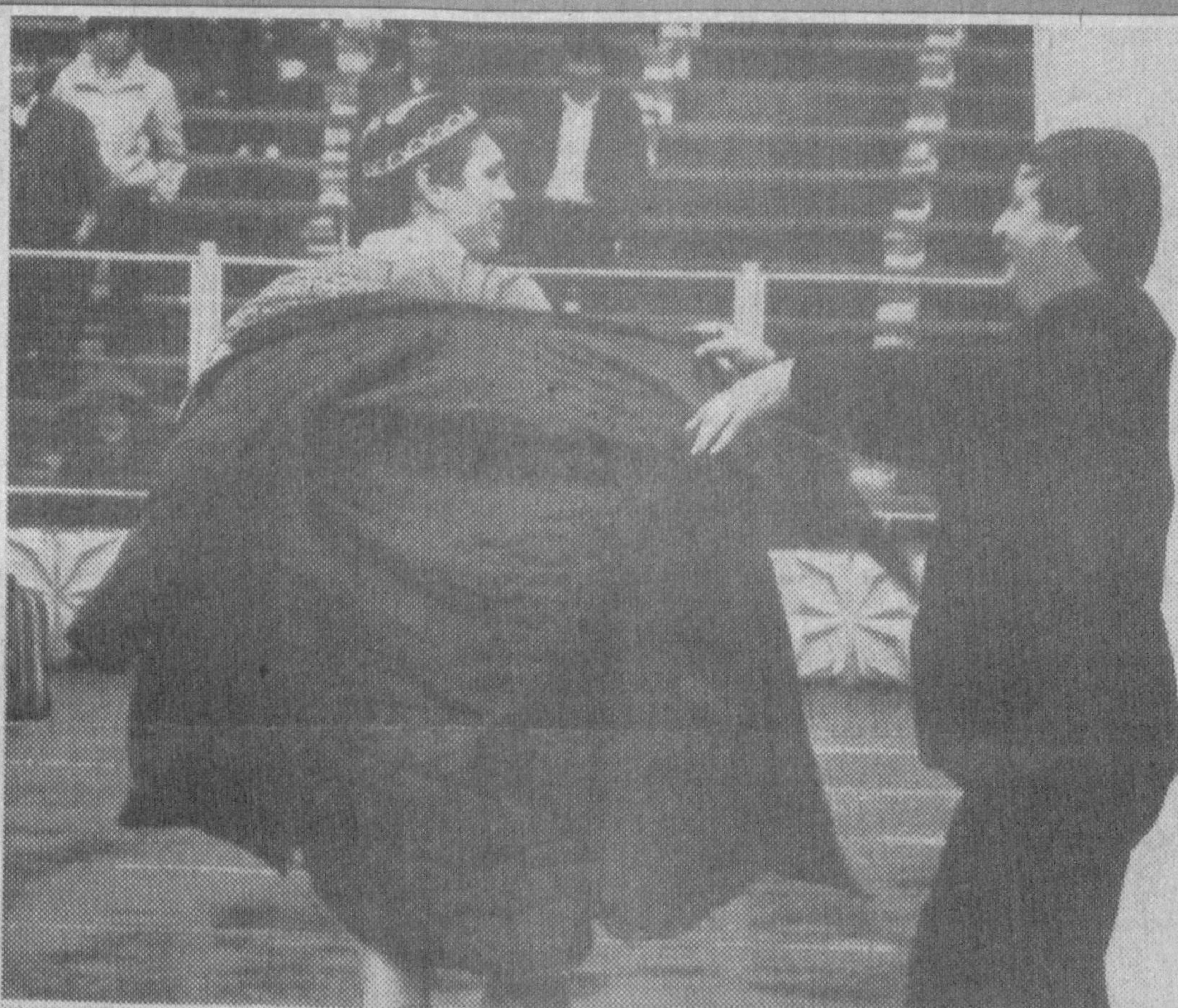
Сиз буни қандай изоҳлайсиз?