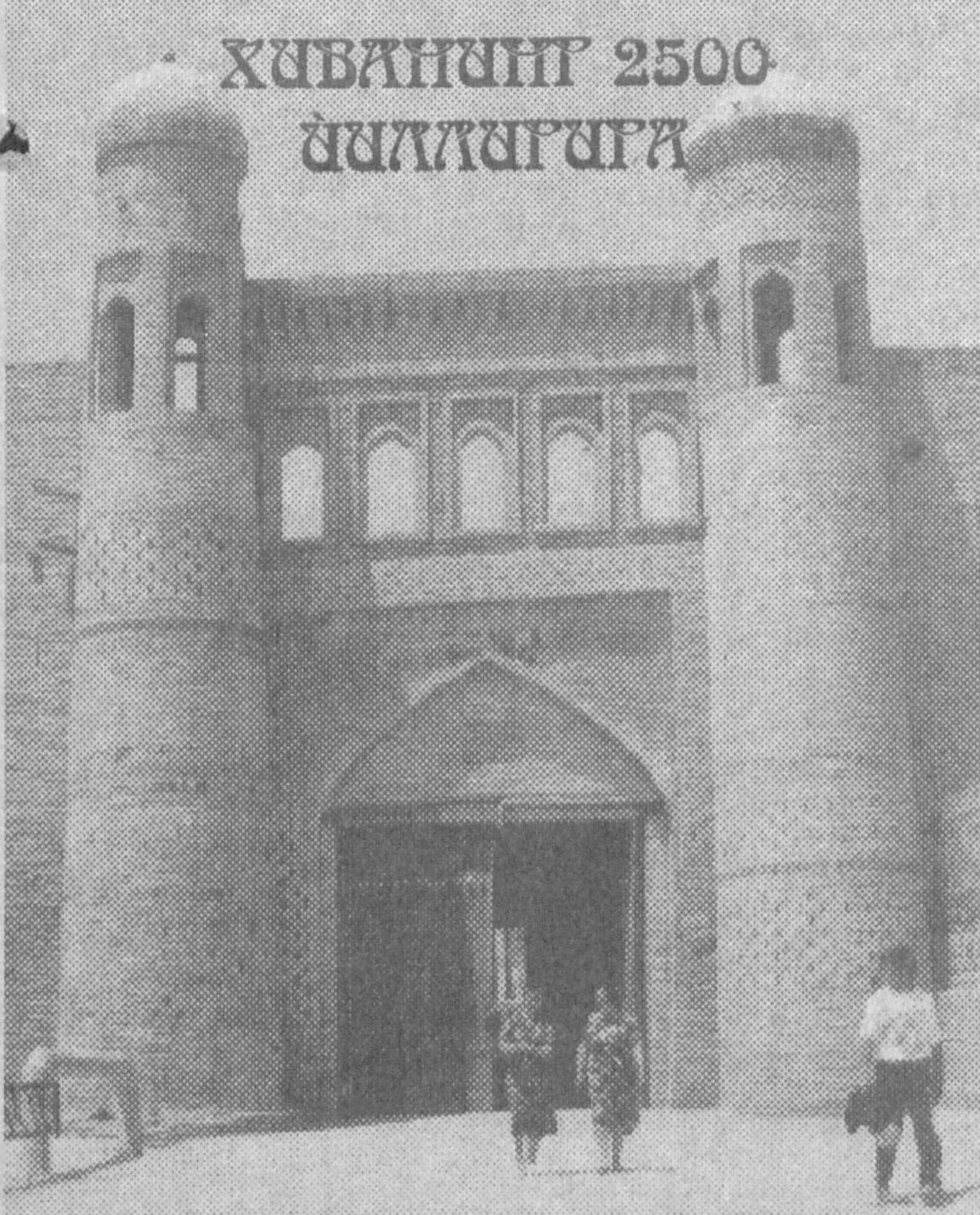
ХИВАНИНГ 2500 ЙИЛЛАРИ

Шаҳар бир пайталари 16 дарвозадан иборат бўлган. Эндиликда шундан 4 та дарвоза қолган: Тош дарвоза, Ота дарвоза, Боғча дарвоза, Полвон дарвоза. Бу тўртта дарвоза шарҳи бугунги кунда ҳам шарҳ, жануб, шимол, гарблан келадиган марказий йўллар билан боғлайди. Хивадан бугунча етиб келган энг қадимий ёдгорликлардан бири Тош дарвоза ҳисобланади. Тарихчилар ҳисобига кура, у VII-XII асрлар оралиғида барпо этилган. Табиийки, бу дарвоза асрлар давомида табиий офатлар, урушлар натижасида неча бор бузилиб, неча бор тикланган. Асрларнинг 80-йилларининг охиридан бошлаб дарвоза таъмирланди ва эндиликда унинг асл қиёфасини куриши мумкин. Солномчиларнинг гувоҳлик беришича, бу дарвоза олдидики катта майдон бўлган. Бу майдонда шохлар, хонлар, беқлар бошчилигида тўйлар, томошалар ўтказилган. Лашкарларнинг жангларга тайёрлиги сезилган. Тош дарвоза VII асрга мансуб деб ҳисобланади, аслида тарихийнинг бундан ҳам қадимийроқ даври ҳақида маълумотлар берилади. Келинг, тасаввуримизга жиндай эрк берайлик.