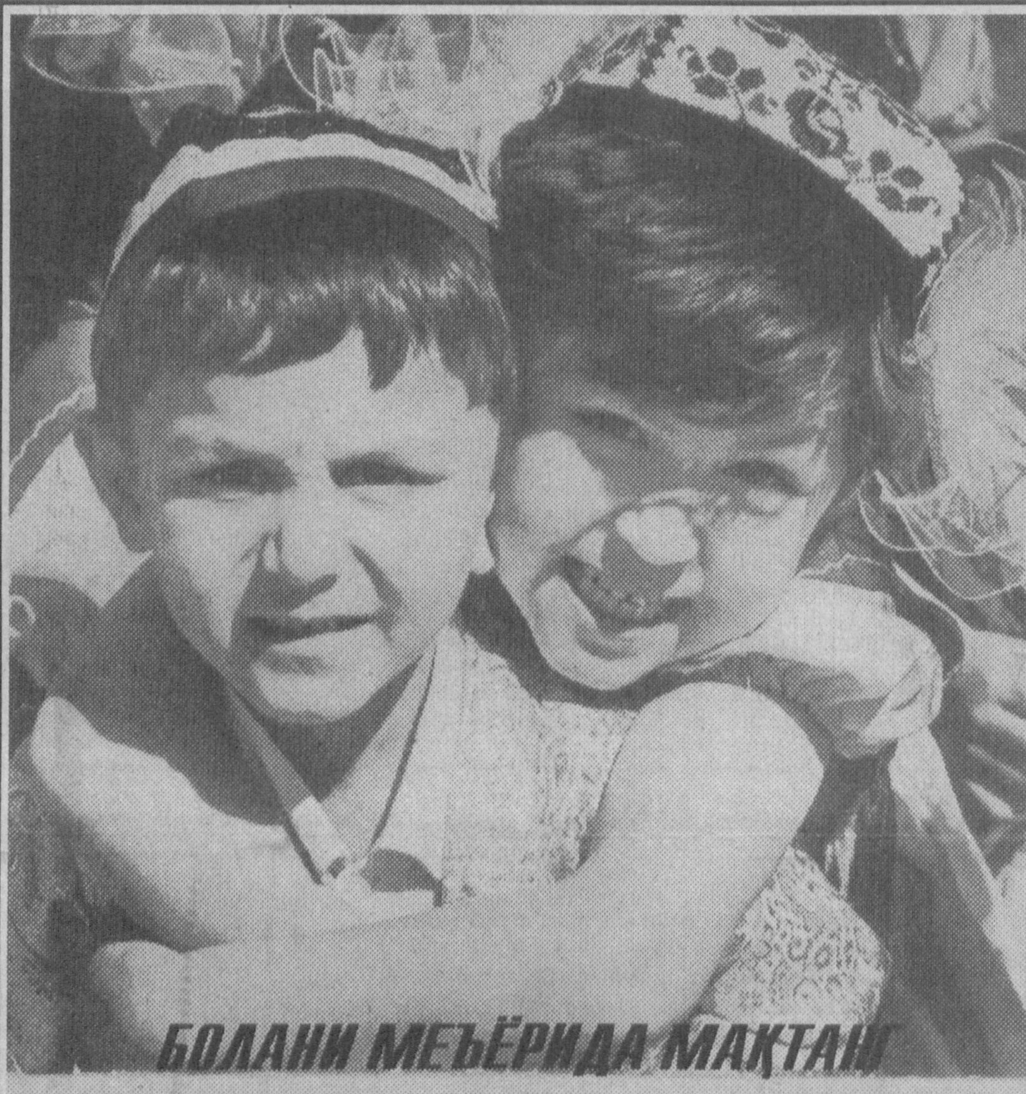
БОЛАНИ МЕЪЁРИДА МАҚТАН

Ҳаётда ҳар-хил нарсаларга қизиқишимиз табиий. Масалан, тўй-томаша, меҳмондорчилик, бозор-ўчар, кунлик фойда ҳар-хил кўвончли воқеалар. Баъзан ана шу нарсалар билан овора бўлиб, булардан ҳам муҳимроқ бўлган бола тарбиясини унутиб қўямиз.