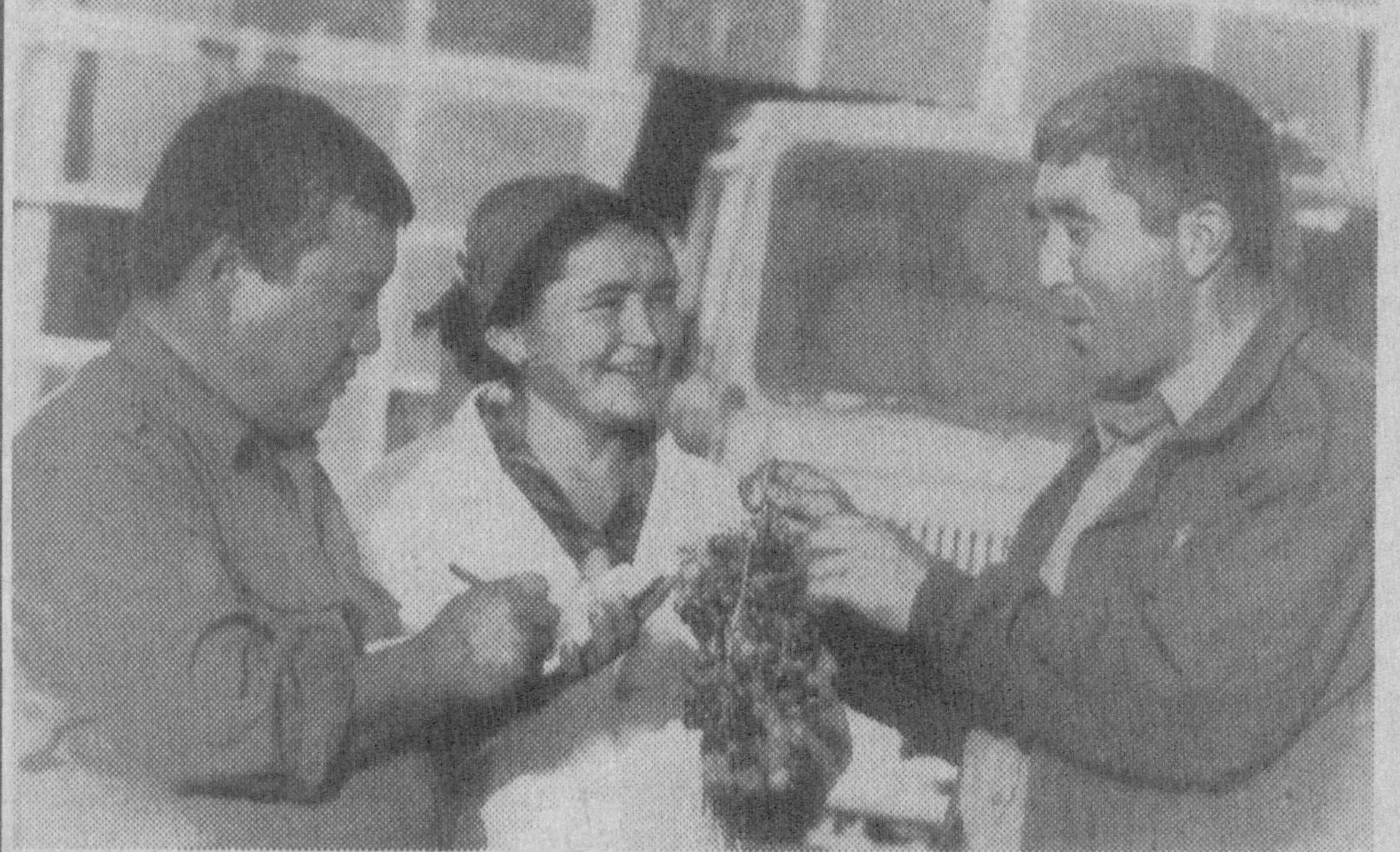
Булунгур туманидаги Мирзо Улуғбек номли очиқ турдаги ҳиссадорлик жамияти кўп йиллардан бери узумдан турли маҳсулот ишлаб чиқариш билан шуғулланади. Бу йил маъзур корхонада 10 минг тонна узум қайта ишланди. Бу ерда ишловчилар учун икки маҳал бепул иссиқ овқат ташкил қилинган.