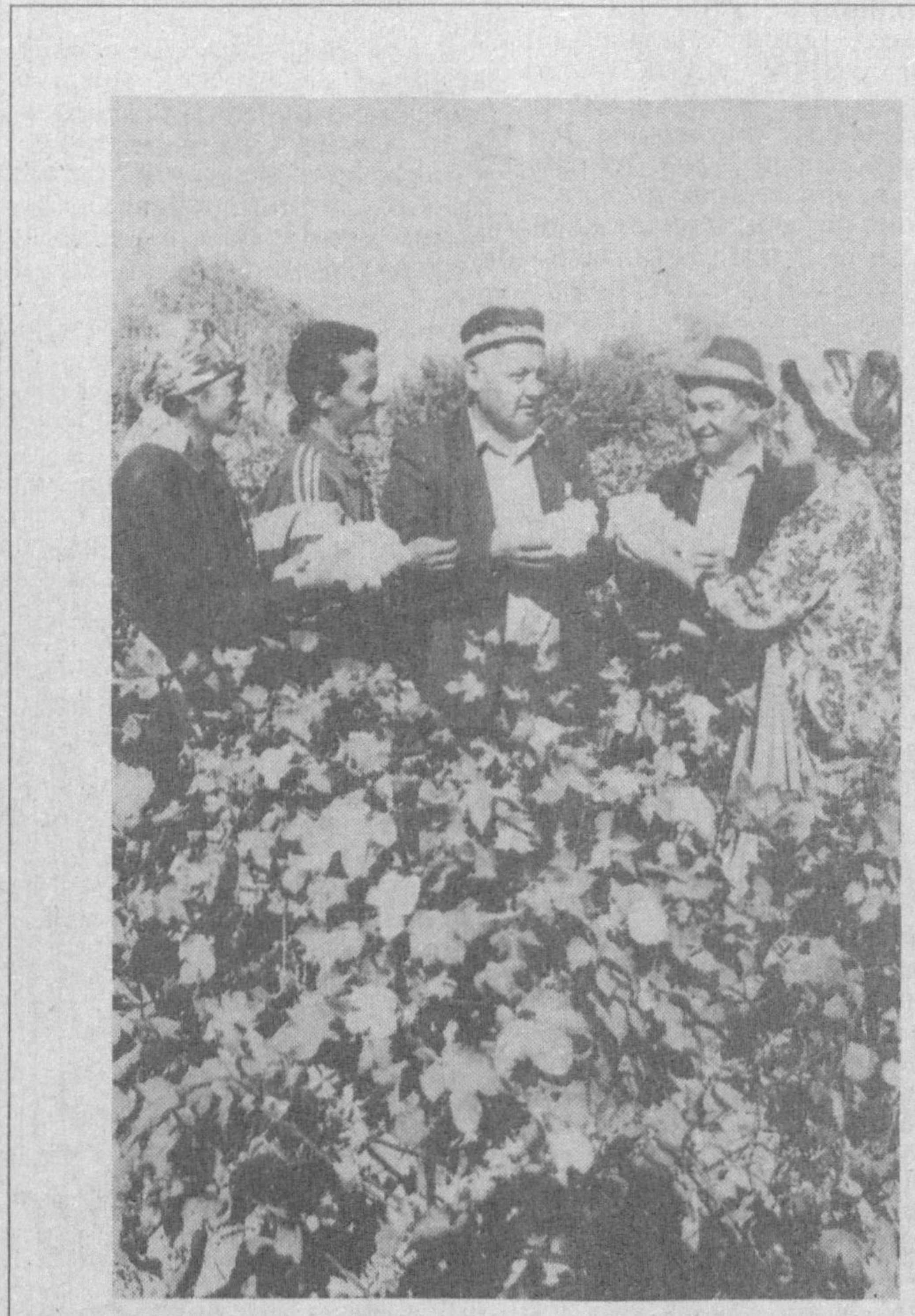
«Пойгага тушар кўп киши, голиб чиқар бир киши» деганлардек, ҳамма баравар голиб бўлавермайди. Бу тал омад 1-бригадга қўлиб бокди.

Фармонда экспорт-импорт операцияларини тариф ва нотариф йўли билан бошқаришнинг барча меъёрлари, шунингдек экспортга маҳсулот ишлаб чиқаришни кенгайтиришни рағбатлантириш бўйича чора-тадбирлар акс этгани муносабати билан Ўзбекистон Республикаси Президентини фармонлари ва Ўзбекистон Республикаси Вазирлар Маҳкамаси қарорларининг илгари қабул қилинган айрим қоидаларни ўз кучини йўқотди.