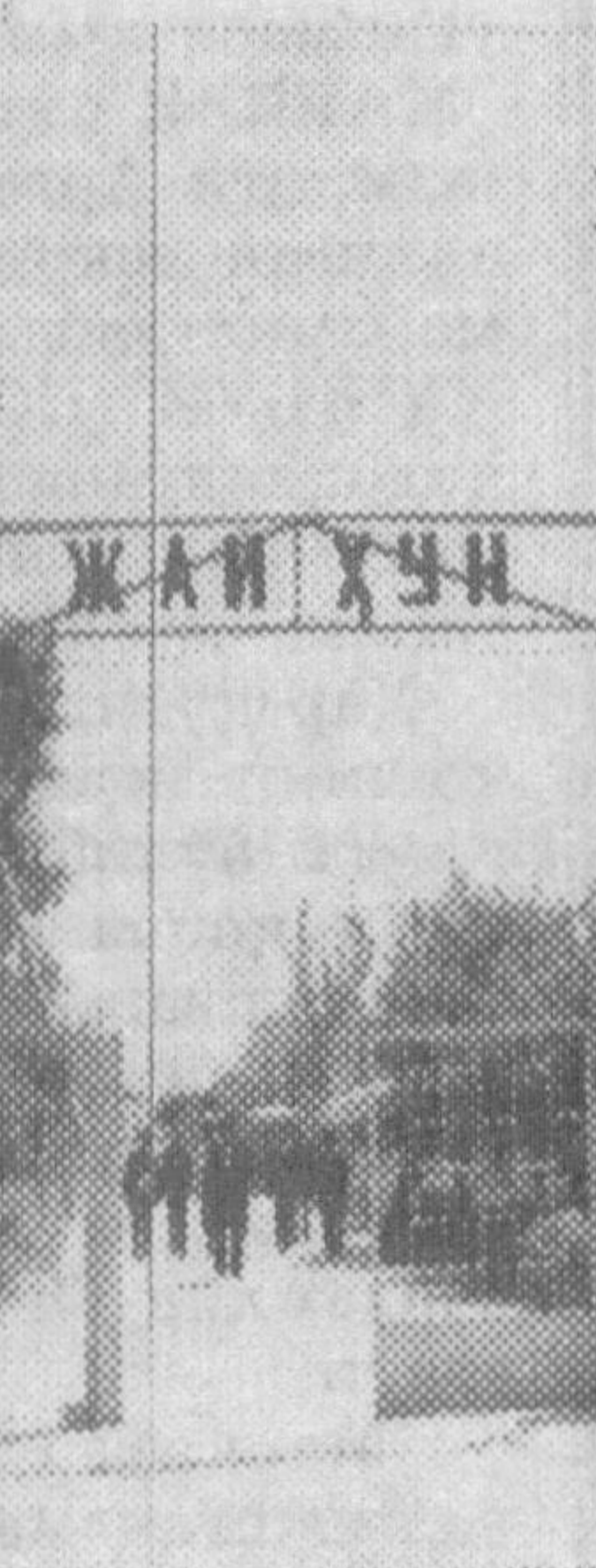
тибборлик Шарифа Олмамова бу ерга келиб, дардан фойиб бўлишганини ва шунинг учун иккинчи марта келишганини миннатдорлик билан таъкидлади.

мобайнида ўн минг нафардан зиёд киши саломатлигини тикладиган тиббий усуналар беморлар хизматида. Билмили ва таҷрибали мутахассислар улар ёрдамида беморлар дардини сингиллаштиришга ҳаракат қилишди. Ҳатто тишларни даволаб, керак бўлса ясама тишлар қўйиш учун қулайликлар яратилган. Сауна ва душ дам олувларнинг ихтиёрида. Даволанувчиларга белгилабган муолажалар билан бир қаторда тўрт маҳал лаззатли парҳез тоғалар, дармондориларга бой шарбатлар, гиёҳли дәмбемалар, маданий ҳордиқ чиқариш учун ранг-баранг талбирлар, кутубхона-янги-янги газеталар бери-бери шусти устига шифо бўлади.