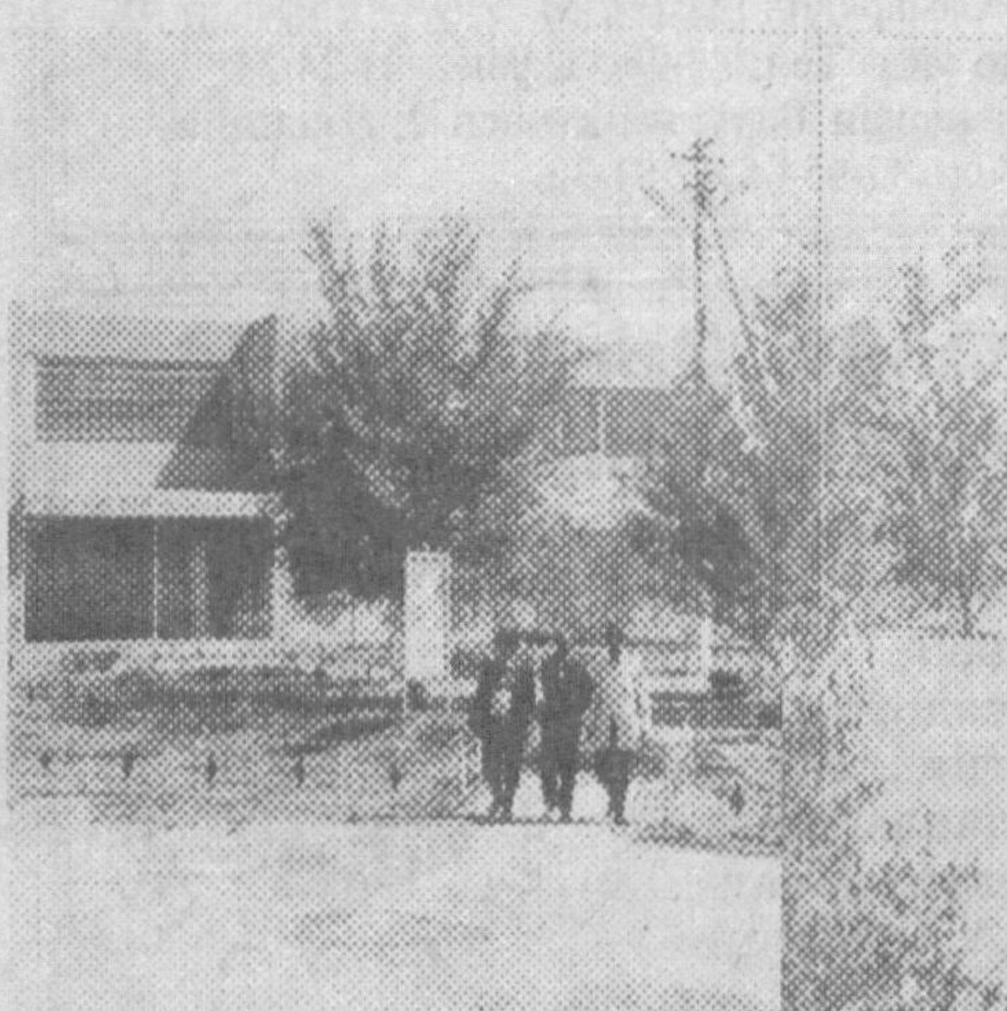
Урганч шаҳридан ўн-ўн беш километр масофада Амударё узынинг ёнбоғидаги ҳаммадан бахона манзилида жойлашган «Жайхун» шифохона мадани сувида ҳудуд ҳудудининг истак ва талабларига бинсан 1991 йил ташкил топган. Бу жойлар