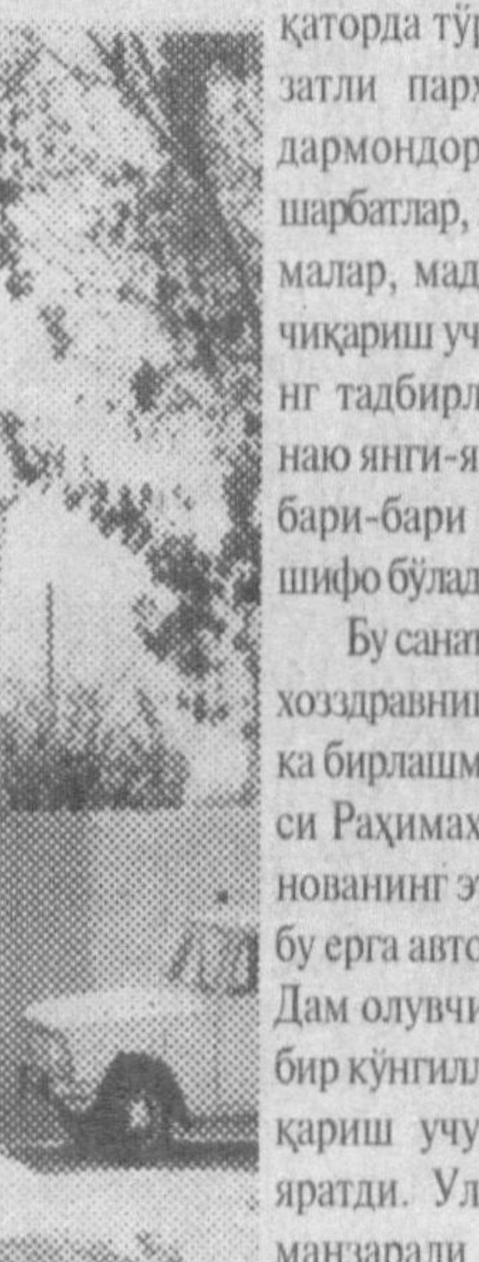
тибборлик Шарифа Олмамова бу ерга келиб, дардан фойиб бўлишганини ва шунинг учун иккинчи марта келишганини миннатдорлик билан таъкидлади.

Паст ва юқори даражали қувват билан ишлаб, инсон саломатлигини тикладиган тиббий усуналар беморлар хизматида. Билмили ва таҷрибали мутахассислар улар ёрдамида беморлар дардини сингиллаштиришга ҳаракат қилишди. Ҳатто тишларни даволаб, керак бўлса ясама тишлар қўйиш учун қулайликлар яратилган. Сауна ва душ дам олувларнинг ихтиёрида. Даволанувчиларга белгилабган муолажалар билан бир қаторда тўрт маҳал лаззатли парҳез тоғалар, дармондориларга бой шарбатлар, гиёҳли дәмбемалар, маданий ҳордиқ чиқариш учун ранг-баранг талбирлар, кутубхона-янги-янги газеталар бери-бери шусти устига шифо бўлади.