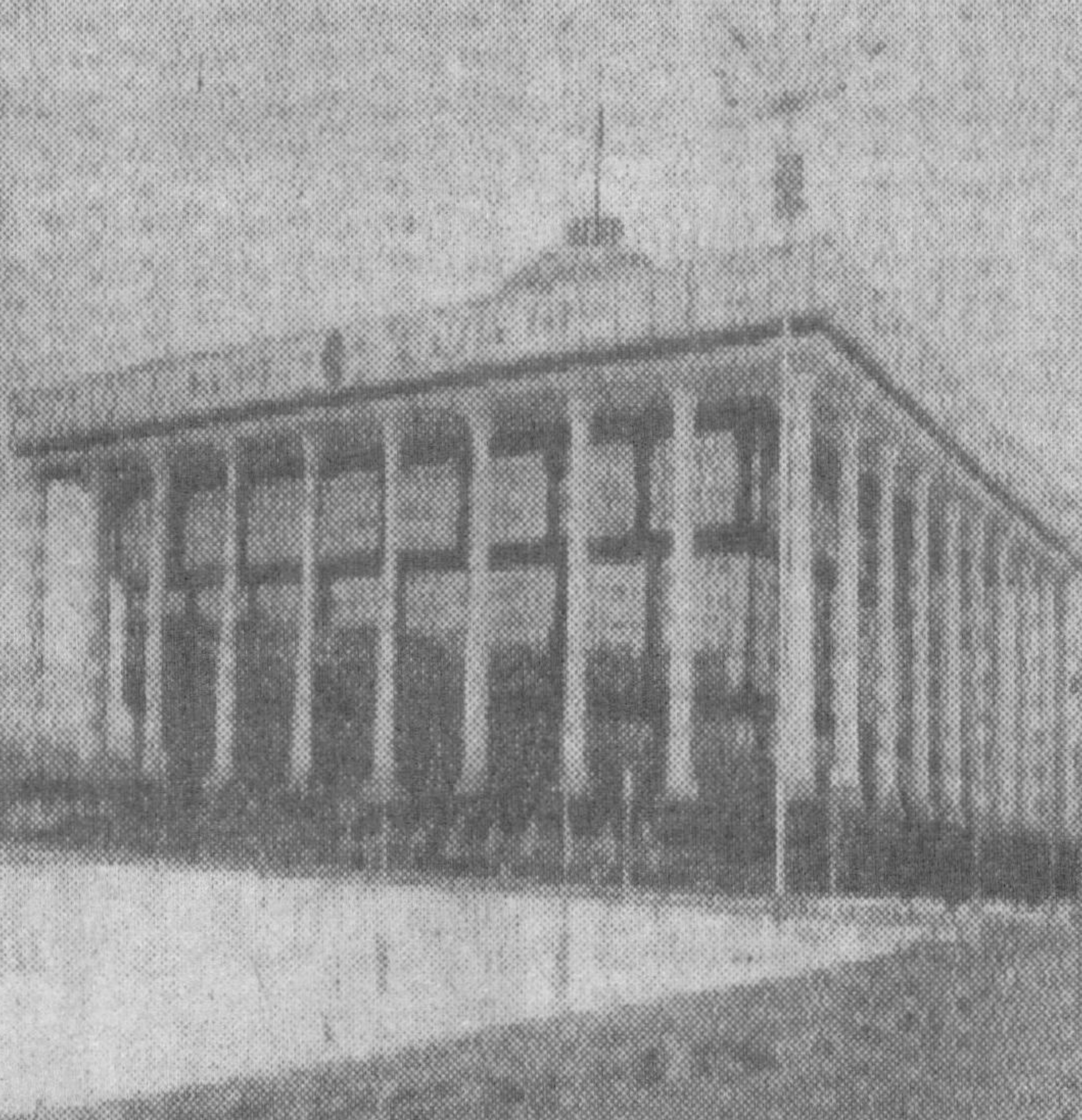
Ўзбекистон Республикаси Олий Мажлисининг X сессияси бугун мана шу янги муҳташам бинода ўз ишнини бошлади.

Мирзачўлининг тунги шаҳарларидан бири Янгиерда вилоят миллий банкининг яна бир бўлими иш бошлади. Янги банк экспорт маҳсулотларини ишлаб чиқаришни ривожлантириш, хориж инвестицияларини жалб этиш, халқаро ҳисоб-китобларни ташкил этиш, валюта активларини марказлаштириш ва улардан самарали фойдаланиш, мижозларга ранг-баранг ва малакали хизмат куратини билан шуғулланиди. Янги банкни «Семурғ» кичик корхонаси қурувчилари парлоздан чиқарди. Бош пудратчи қисқа фураатда 40 миллион сумлик иш бажарди. Қўли гул қурувчилар маҳорати туфайли 20 йиллик бино қайтадан яшарди. Н.ШАМСИЕВ, «Ишонч» муҳбири.