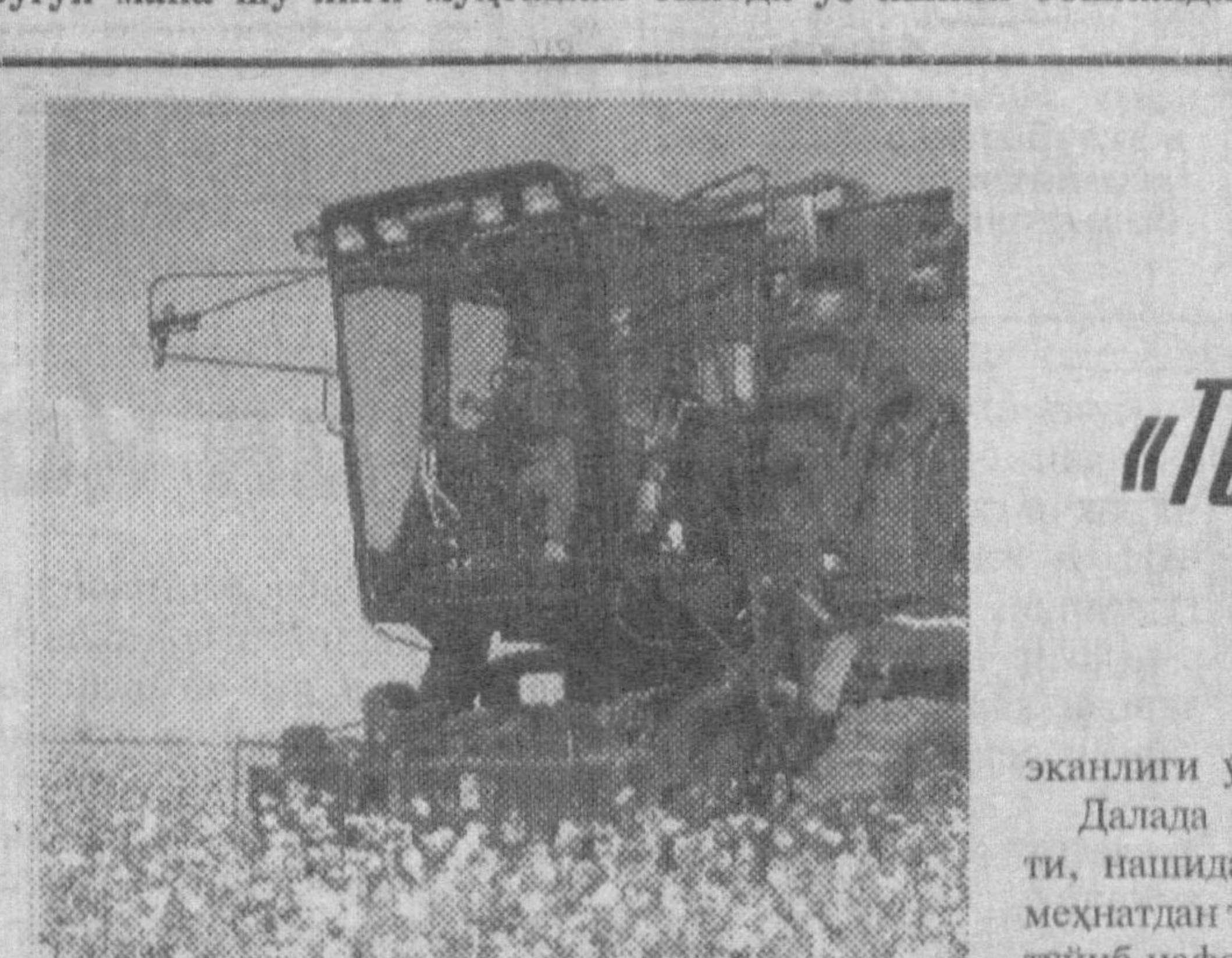
Бепоян пахтазор узра жалон уриб, бодроқ бўлиб олинган «оқ олтин»ни бир текисда териб олаётган «дала елканлари»га, штурвални маҳкам ушлаб, бошқариб бораётган механизатор йиғтиқчиларга, бункеридан хирмонга пахта тўкаётган курали техникага, янги ҳосилни ортиб бораётган «оқ олтин» қаровонларига неча бор кузини тушанган, уларга суқлиниб боканасиз, албатта. Бу — далада йил бўйи қилинган меҳнатнинг бир булагини, самарасини, энг масъулятли палласи эканлиги уз-узидан айни.