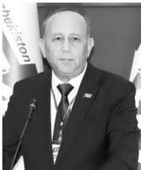
Шарофиддин НАЗАРОВ, Ўзбекистон Республикаси Олий Мажлиси Қонунчилик палатасининг Бюджет ва иқтисодий ислохотлар қўмитаси раиси:

Ўзбекистон Халқ демократик партияси Ахборот хизмати.