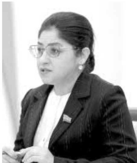
Малика ҚОДИРХОНОВА, Олий Мажлис Сенатининг Хотин-қизлар ва гендер тенглик масалалари қўмитаси раиси:

Мамлакатимиз равнақи, халқимиз келажиги учун Президент сайловида миллатидан қатъи назар, барча юртдошларимиз фаол қатнашади, деб ишонаман.