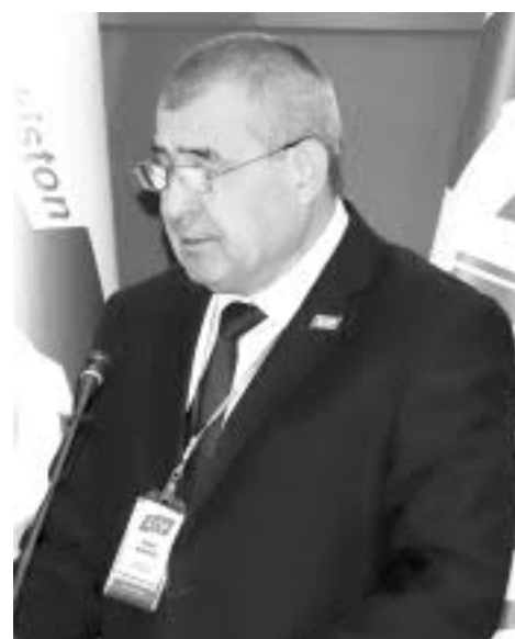
Эркин ГАДОВЕВ, Ўзбекистон Республикаси Олий Мажлиси Сенати Бюджет ва иқтисодий ислохотлар масалалари қўмитаси раиси:

Сўзимнинг якунида, Қурултой кун тартибига киритилган қарор лойиҳаларини қўллаб-қувватлаган ҳолда, партияимизнинг Ўзбекистон Республикаси Президенти сайловида муносиб иштирок этишида ҳар бир партия аъзоси, депутатлар, туман, шаҳар Кенгашлари, бошланғич партия ташкилотлари, фаолларимизга солиқ-саломатлик ва муваффақият тилаб қоламан.