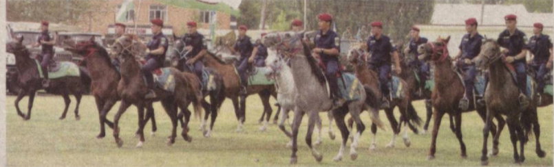
Тадбирда 4 минг киши қатнашди. Эликдан ортиқ корхона ва ташкилот ўз маҳсулотларини намойиш этди. Кун давомида бўш иш ўринлари ҳамда китоб