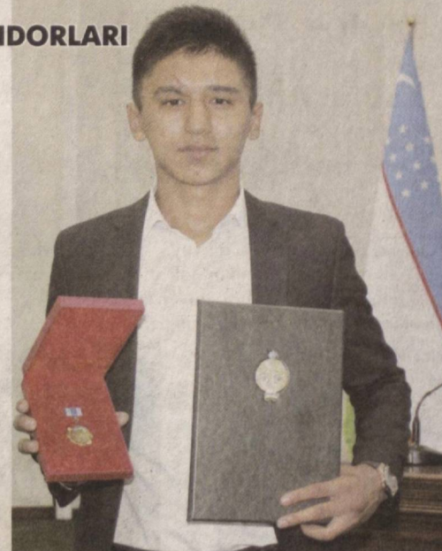
Мақсадим — 2022 йилда бўлиб ўтайдиган Олимпиада уйинлари совриндори бўлиш. Илло,

Айни вақтда навбатдаги Осиё чемпионатида тайёргарлик қураяман. Насиб этса, бу сафар ҳам галаба билан қайтаман.