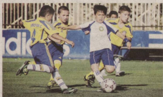
Мусобақа Жисмоний тарбия ва спорт вазирлиги, Фуқароларнинг ўзини ўзи

Пойтахтимизда маҳалла ёшлари ўртасида “Чарм тўп” футбол мусобақасининг якуний босқичи бўлиб ўтди.