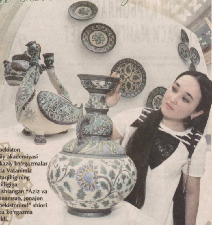
O'zbekiston Badiiy akademiyasi markaziy ko'rgazmalar zalida Vatanimiz mustaqilligining 27 yilligiga bag'ishlangan "Aziz va yagonamsan, jonajon O'zbekistonim!" shiori ostida ko'rgazma ochildi.

Unda tasviriy san'at ustalarining ijodiy ishlari bilan birga yosh rassomlar ham o'z asarlari bilan qatnashmoqda. So'nggi yillarda haykaltaroshlik keng ommalashgan san'at turiga aylandi. Ayniqsa, yurtimiz shaharsozligida tarix va madaniyat arboblari