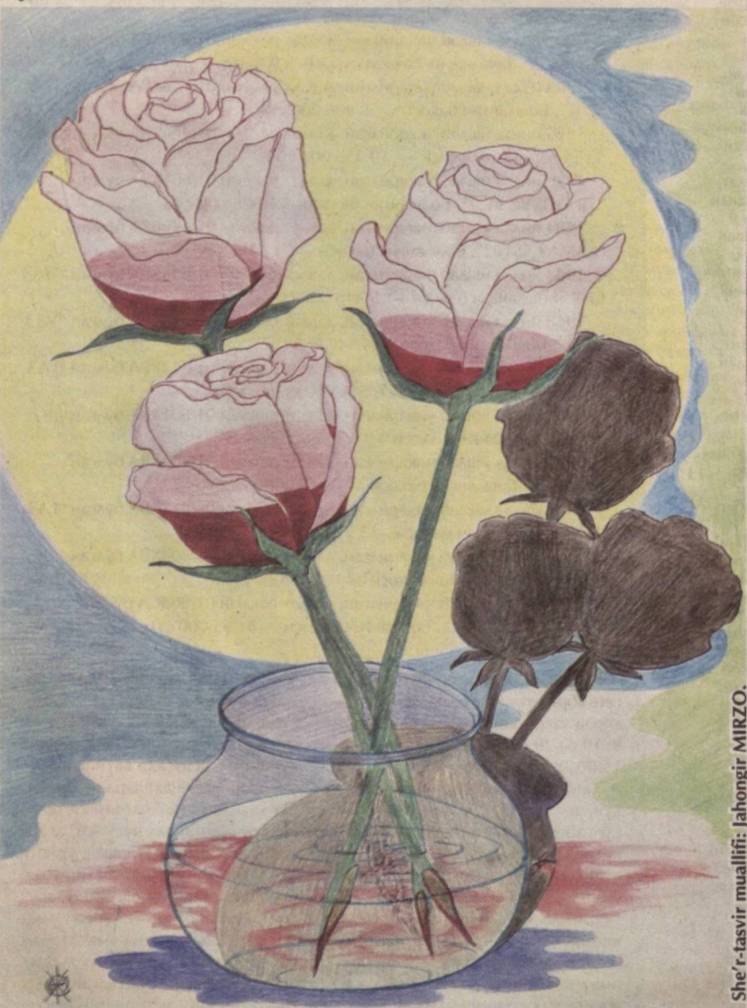
She'r-tasvir muallifi: Jahongir MIRZO.

DO'STIM, AVVALAMBOR, KO'NGLING BO'LSIN OBOD, QOLGANIGA YARATGANDAN TILA SABOT!