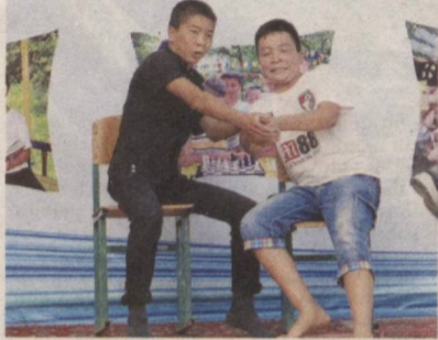
Ташаббус жиноятчиликнинг олдини олишга қаратилди. Тажрибали психологлар, спорт мураббийлари

Ёшлар иттифоқининг Қорақалпоғистон Республикаси кенгаши Нукус шаҳридаги "Ёш авлод" ёзги дам олиш ва соғломлаштириш оромгоҳида "Тарбия ва спорт-соғломлаштириш оромгоҳи" лойиҳасини амалга оширди. Унга ички ишлар органлари профилактик ҳисобида турган 66 нафар йигит-қиз қамраб олинди.