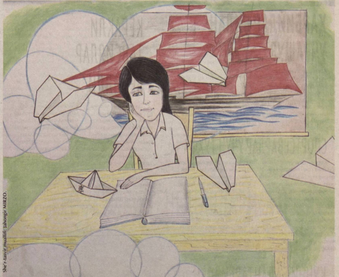
She'r-kasbiy muallifi: Jahongir MIRZO.