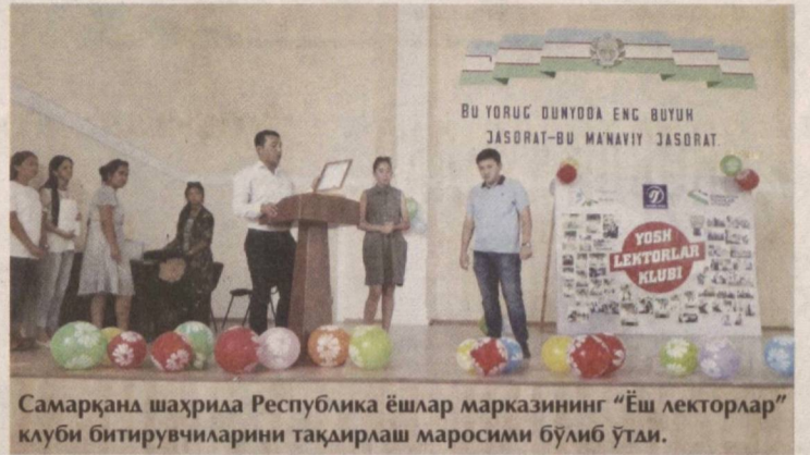
Самарқанд шаҳрида Республика ёшлар марказининг "Ёш лекторлар" клуби битирувчиларини тақдирлаш маросими бўлиб ўтди.

Ёшларнинг фикрини ўрганиш, уларнинг бўш вақтини мазмунли ўтказиш мақсадида ташкил этилган мазкур клубнинг вилоят бўлимида уч ой давомида 104 нафар йигит-қиз тахсил олди. Уларнинг 48 нафари имтиҳонларни аълога топ-