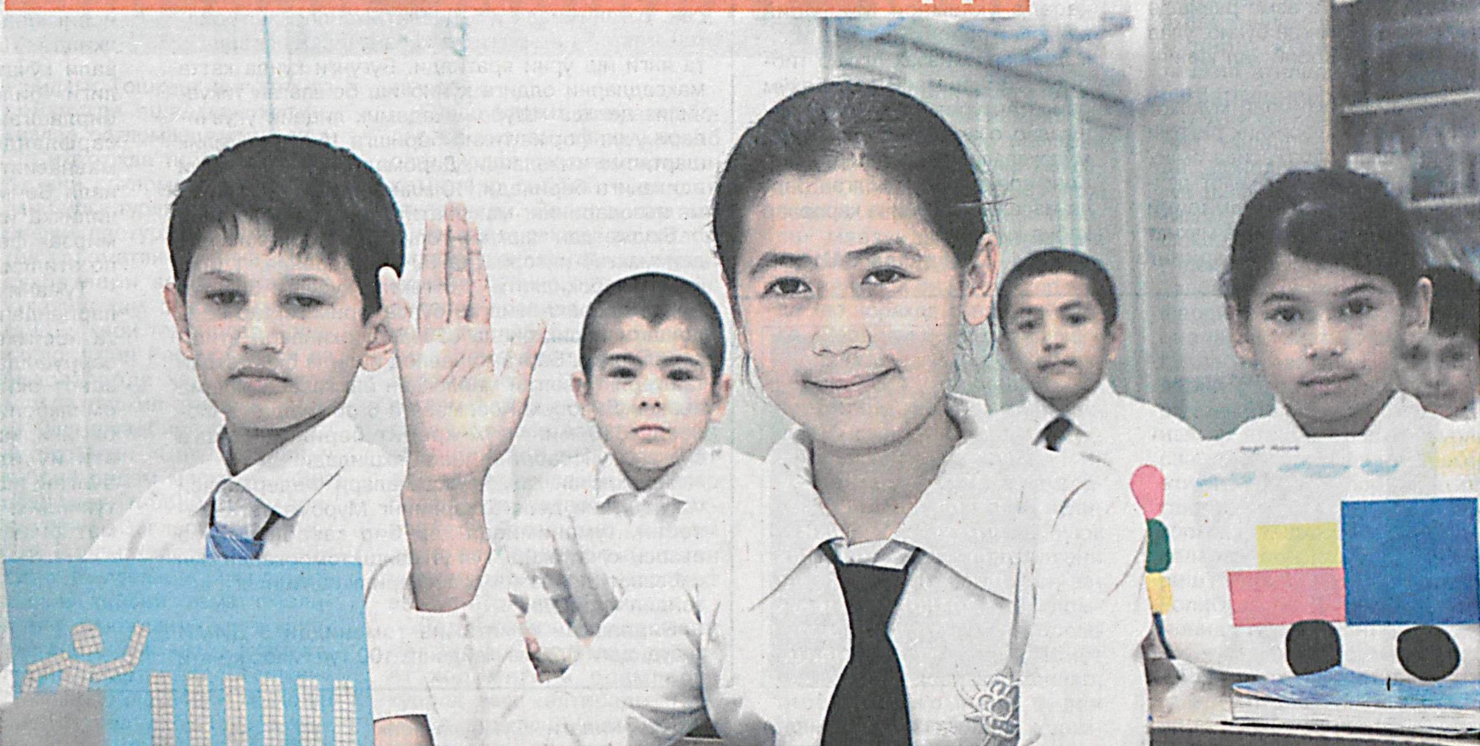
Наманган шаҳридаги 1-ихтисослаштирилган мактабда таълим сифати ва самарадорлигини оширишга алоҳида эътибор қаратилмоқда.

Хорижий тилларни ўргатишга ихтисослашган мактабда 1200 нафардан зиёд ўқувчи малакали ўқитувчи-педагоглардан сабоқ олмақда. Ўқувчилар бу ерда пухта билим эгаллаши, спорт билан мунтазам шугулланиши учун барча шарт-шароит яратилган. Мактаб қошида очилган турли фан ва санъат тўғрақлари, замонавий спорт зали, ахборот-ресурс маркази ўғил-қизларга дарсдан сўнг бўш пайтларини мазмунли ўтказиш имконини бермоқда.