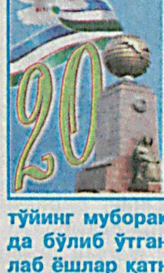
Тўйнинг муборак! шiori остида бўлиб ўтган тадбирда юзлаб ёшлар қатнашди.

Кадимий ва навқирон Бухоро шаҳрининг марказий маданият ва истироҳат боғида «Ватаним, кутлуг тўйнинг муборак!» шiori остида бўлиб ўтган тадбирда юзлаб ёшлар қатнашди.