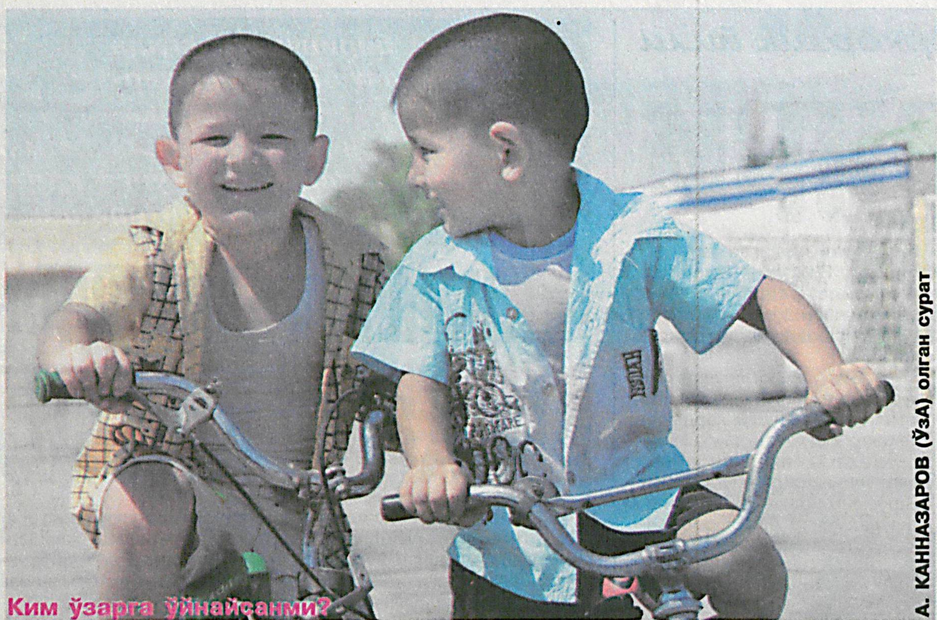
Ким ўзарга ўйнайсанми?