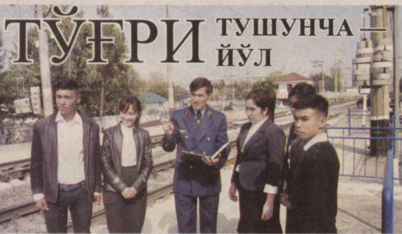
Зангиота туманидаги 43-умумтаълим мактабда “Темир йўл ҳудудда огоҳ бўлиш, ўқувчи!” шиори остида тарғибот тадбири ташкил этилди.