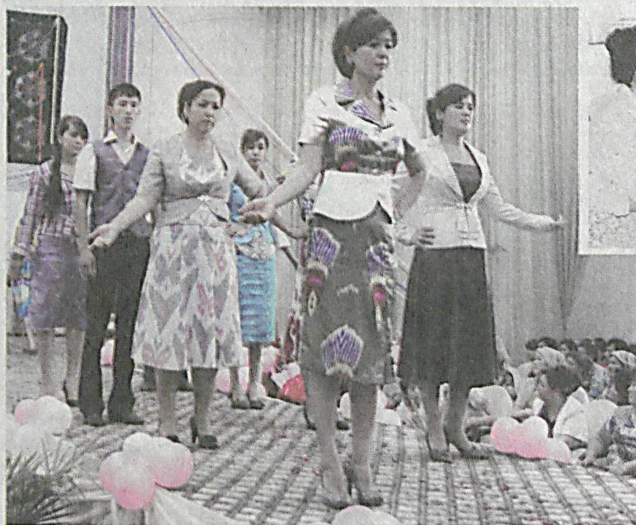
Юртимизда либослар намоишига бағишланган кўллаб тадбирлар ўтказилмоқда. Миллий матоларимиз — атлас, адреснинг товганиши кимни лол қолдирмаган дейсиз. Бу борада кўҳна анъаналаримиз давомчилари бўлмиш кўлигул чеварларимиз маҳоратига қойил қолмай илож йўқ.