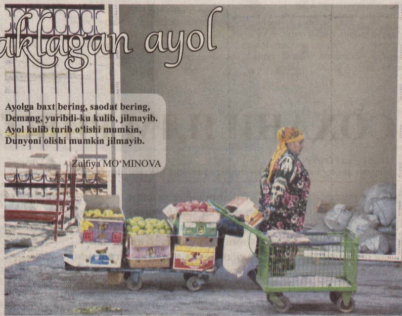
Ayolga baxt bering, saodat bering. Demang, yuribdi-ku kulib, jilmayib. Ayol kulib turib o'lishi mumkin, Dunyoni olishi mumkin jilmayib.