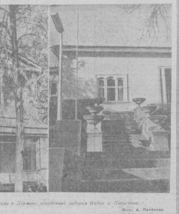
Ташкент. Загородные резиденции в Дормане, отведенные лидерам Индии и Пакистана.

КАРАЧИ, 6 января. (ТАСС). Пакистанская печать уделяет большое внимание начавшимся в Ташкенте переговорам между Президентом Пакистана Айюб Ханом и Премьер-Министром Индии Шастри.