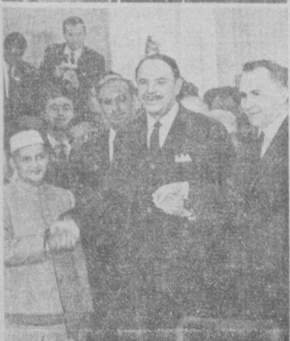
Ташкент, 10 января 1966 года, 4 часа дня по местному времени. Заключительная встреча за круглым столом и подписание Ташкентской декларации.