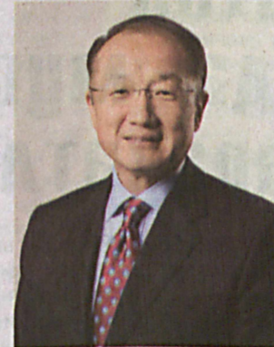
Жаҳон банки президенти Жим Ён Ким

кор этишнинг имкони йўқ. Сабоби давлат раҳбарлари ва молия вазирлари тўғридан-тўғри хорижий инвестициялар камийиши мумкинлиги билан боғлиқ таваккалчиликка дуч келди. Чунки компаниялар энг мақбул ишбилармонлик муҳитига эга мамлакатларга сармоя киритишга афзал билади. Кейинги 15 йилда «Doing Business» ҳисоботлари 3180 дан ортиқ ислоҳотни амалга оширишга кўмаклашди. Бугунги кунда банк худди шундай ёндашувни илгари сурган ҳолда, ҳукуматларни инсонларга сармоя киритишга даъват этмоқда. Жаҳон банки гуруҳи вакиллари инсон капитали ходимларининг кейинги авлоди иши са-